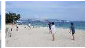
伊江島でビーチバレー