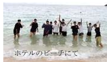
ホテルのビーチにて