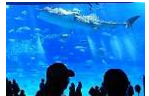
水族館 ジンベイザメ