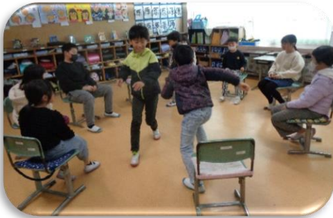
フルーツバスケット

12月7日(木)には「なかよし集会」で、人権担当の大月先生のお話を聞いた後縦割り班遊びを行いました。縦割り班のリーダーの6年生が、みんなが仲良くなれる遊びを企画し運営しました。川東小の児童は日常的に異学年での交流が多く、上級生と下級生がうまく関わるできています。