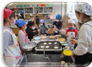
2年学級P どんぶり焼き作り