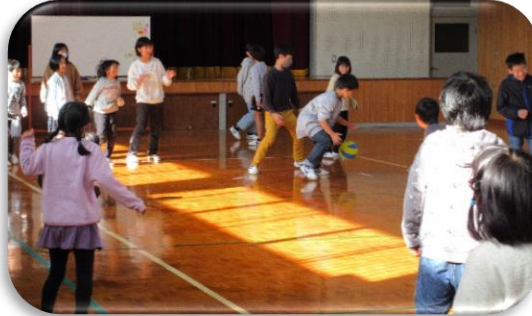
↓ ドッジボール ↑