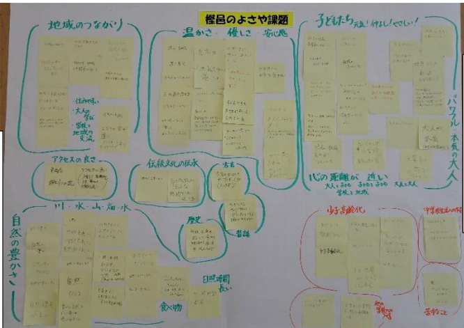
梶邑のよさや課題