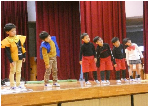
1年 チームワーク賞