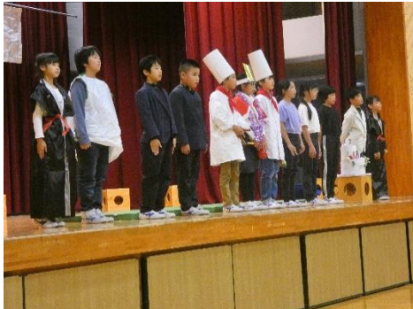
4年 エンターテイメント賞