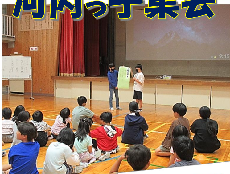
人権の花が咲きました♪