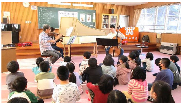
バロック音楽の生演奏に聴き入る児童ら

いよいよ演奏になると、音楽室の空気が変わり、子どもたちは一気に曲の世界に引き込まれていました。「カントリーロード」といったよく知っている曲では、自然と体が動き、演奏に合わせて歌っていました。