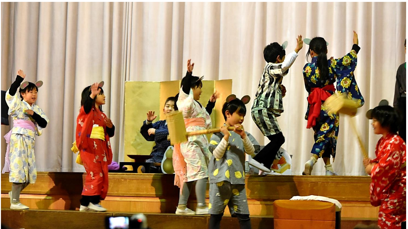
役になりきって演じる児童ら

11月5日(土)、学習発表会を行いました。早朝より、約100名ものご家族や地域の方にお越しいただき、発表ごとに会場は大きな拍手があふれました。