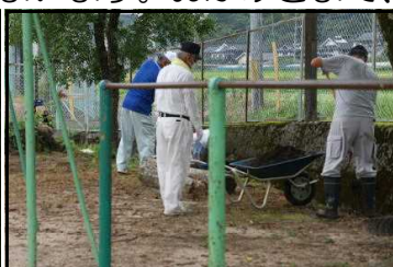
運動場周辺の溝さらい