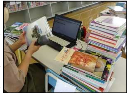
バーコードリーダーを使って登録

登録冊数4,032冊、ボランティア参加者2日間で延べ22人。膨大な数の本のラベル貼りと登録作業をしていただきました。本当にありがとうございました。おかげさまで湯原小学校の図書のデータ化が完了しました。これにより、2学期以降、図書の貸し借りがバーコードで簡単に行うことができ、しかも管理が大変しやすくなります。これは真庭市内全ての小中学校でも推進されているものです。湯原小学校の図書室にとっては大きな節目の年になりました。今後もますます子ども達には本に親しんでもらいたいと思います。