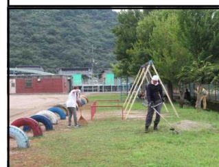
草刈り機を使って草刈り