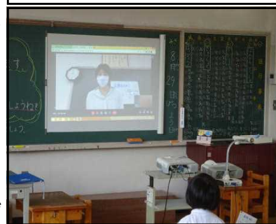
コロナ対応の説明