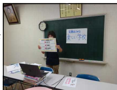
生活のきまりの説明

始業式では私から「2学期、笑顔あふれる楽しい学校にしよう。」、生徒指導担当から「3つのあ（あいさつ・あつまり・あとしまつ）をしっかりしていこう。」、養護教諭から「新型コロナウイルス感染症から身を守るための取組」について、それぞれ話をしました。会議室からリモートで行い、子ども達は各教室で話を聞きました。体育館のときと同じようにしっかり目で話が聞けたようです。「学校の新しい生活様式」に、教員も子ども達も徐々に慣れてきて、充実した2学期にしたいと思います。