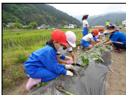
1・2年生 サツマイモの苗植え