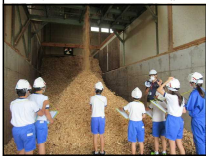
5年生 バイオマスツアー