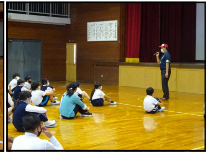
高学年 自転車の安全な乗り方