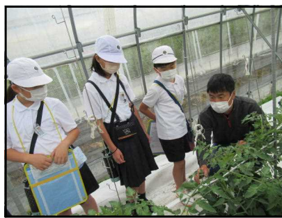
4年生 トマト栽培見学