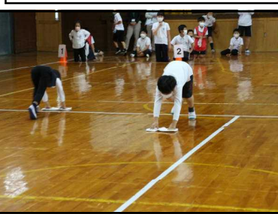
全校 ぞうきんがけ集会