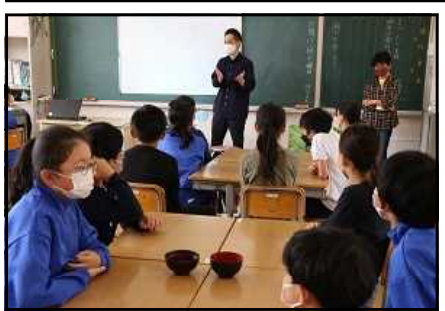
5・6年生 郷原漆器体験活動