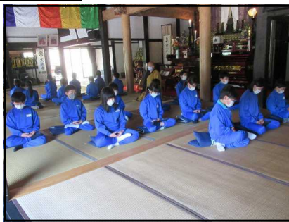
中学年 大林寺での座禅体験