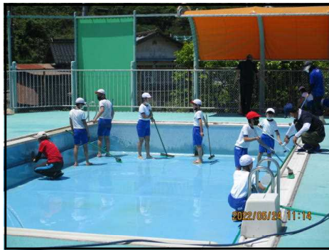
6年生は小プール担当です

4～6年生が協力してプールそうじをしました。毎年、中学生が仕上げをしてくれます。6月6日がプール開きの予定です。今年もしっかり練習をして、水に慣れ親しんでもらいたいものです。