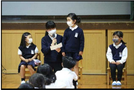
1年生インタビュー

6年生が中心になって会を企画、運営して1年生を迎える会をしました。湯原小クイズや1年生インタビューなどがあり、ほのぼのとした温かい雰囲気です。1年生インタビューでは少し緊張しましたが、好きな遊びや将来の夢などを上手に言うことができました。在校生のお兄さんやお姉さんは1年生が困っていたら、やさしく、親切に色々なことを教えてあげられるといいですね。