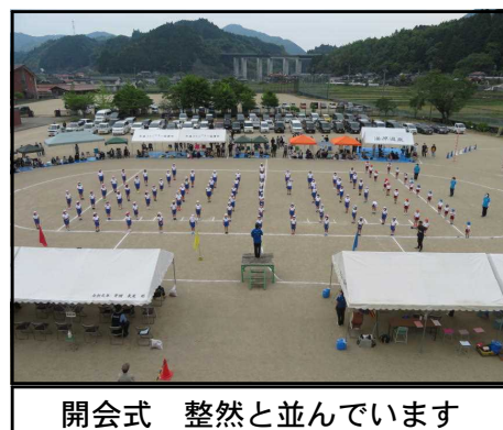
開会式 整然と並んでいます

子ども達はこの運動会を通して、達成感・充実感を覚え、友達と協力することの大切さ、友達を応援することの大切さなど多くの学びを獲得することができました。この運動会を通して、子ども達の成長に欠かすことのできない貴重な経験をすることができました。ありがとうございました。