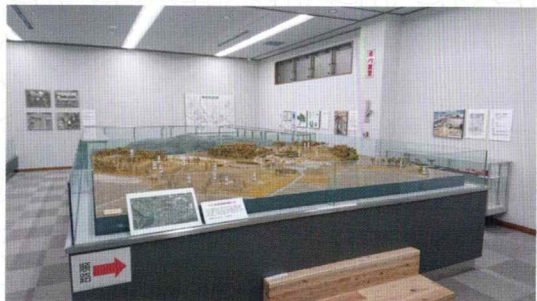
四ツ塚古墳群のジオラマ