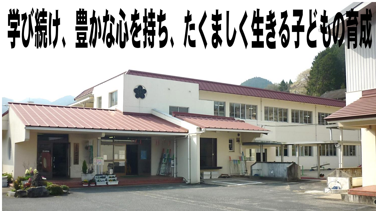
46年目を迎える月田小学校の校舎

令和4年度がスタートしました。8名の新入生を迎え、全校児童46名でのスタートです。