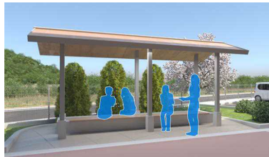
バイオガスを活用した足湯の様子