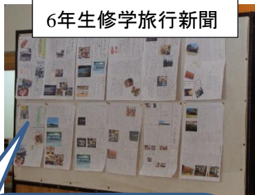
6年生修学旅行新聞