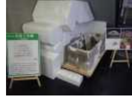
これまでの講座活動の様子