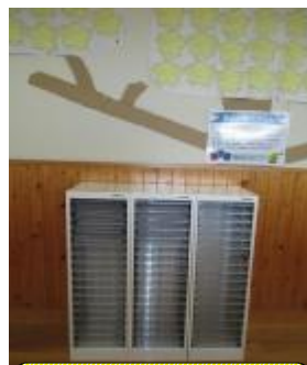
自主学習プリントのたな