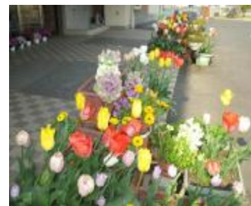
咲き誇る 久世中玄関前の花