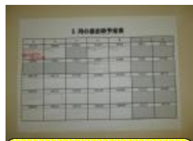
提出課題月間スケジュール

本年度の久世中学校の取組の一つが「家庭学習の充実」です。今まで、課題が漢字や単語を機械的に書くだけの作業になり、答えを丸写しして出すといった人たちがいましたが、それでは本当の力がつきません。また、人によって取り組みたい課題のレベルは様々です。授業と連動し、学習したことが効率よく定着するように、また、個人の学力や個性が伸ばせるように課題の出し方を研究しています。一斉に取り組む課題については月間スケジュールを廊下に掲示し、自分で計画的に取り組めるようにしています。自主学習については、すでに多くの方が実践していますが、何をやったらよいか迷っている人のために各学年、廊下に棚を設置し、レベルにあった国・数・英のプリントを選択できるように用意しています。また、臨時休校をきっかけにeライブラリーで学習する人も増えているようです。Stay Homeの今こそチャンスでもあります。この機にこれから必要とされる学習習慣を身につけてしまいましょう！！