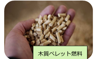
木質ペレット燃料