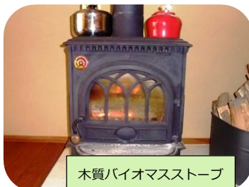
木質バイオマスストーブ