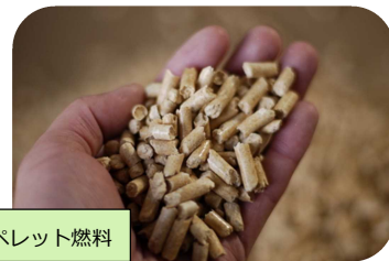
木質ペレット燃料