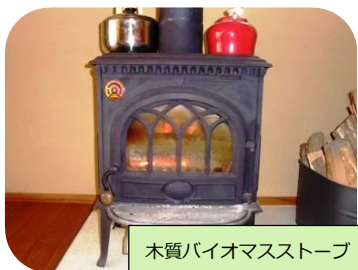
木質バイオマスストーブ