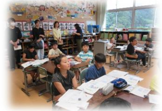
参観日の様子 4年生