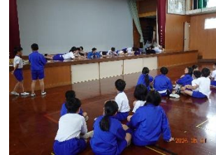
ジェスチャーあて