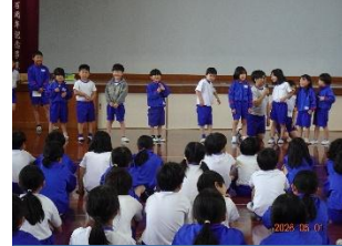
1年生インタビュー