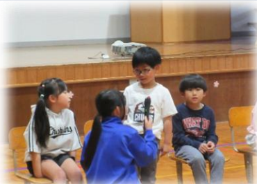
1年生にインタビュー