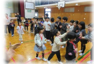
笑顔でハイタッチ

4/30(木) 1年生を迎える会がありました。1年生は、全校の前で堂々とインタビューに答えることができていました。そして6年生が考えたクイズを全校で楽しみました。2年生は1年生へのプレゼントを作って渡しました。プレゼントをもらって1年生は笑顔いっぱいになっていました。6年生の皆さん、企画から準備、当日の司会進行や運営までありがとうございました。6年生のチームワークのよさを改めて感じました。これからも学校のリーダーとしてみんなを引っ張っていきましょう。