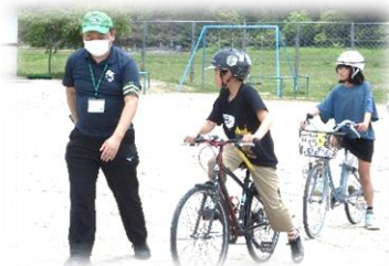
3年生以上 安全な自転車の乗り方

4/28(火)岡山県交通安全協会から「みどり号」に来ていただき、交通安全教室を行いました。1・2年は信号のある横断歩道の渡り方等、3～6年は自転車の乗り方と自分でできる自転車点検の仕方を学びました。4月から道路交通法が改正されました。小学生のうちから自転車に乗る時に、ルールを守らなければいけないことを意識できるように学校でも指導していきます。ご家庭でも話をしてみてください。