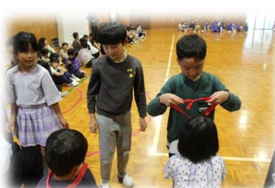
2年生からプレゼント