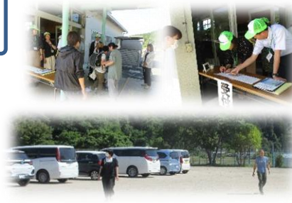
5/15 落合中学校区 合同引き渡し訓練

5/7(木) 火災避難訓練を行いました。自分の教室から火元を避けてどこを通って避難すればいいか避難経路の確認と安全に避難するために大切なことの確認を行いました。「お・は・し・も・し」の約束を守ることや火元がどこかを落ちていて聞くことが自分の命も友達の命も守ることにつながることを消防署の方にお話していただきました。