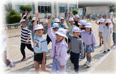
1・2年生 信号のある 横断歩道の渡り方