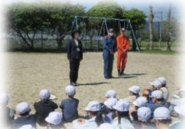
消防署の方のお話