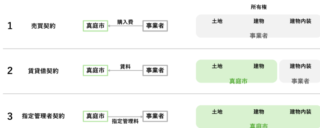
図2 想定される一般的な契約手法及び所有権について

運営にあたり想定される一般的な契約手法を図2に示します。あわせて、それぞれの契約における金額の目安も示します。なお、図2に示す3つの契約手法以外の提案も可能です。