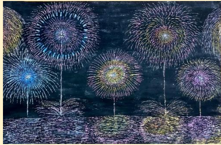
佳作 名越由梨菜 「花火」