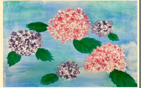
佳作 山本彩希 「あじさい」