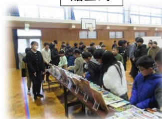
65冊も本を贈呈していただきました!