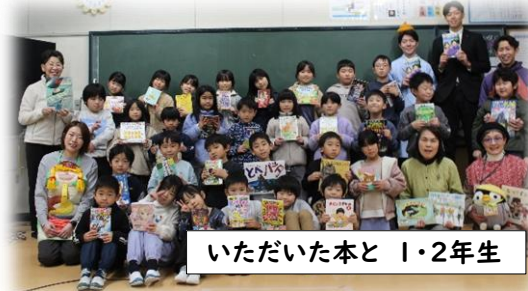
いただいた本と 1・2年生

12/17(水)ミキプルーン文庫の贈呈式がありました。読み聞かせボランティアの皆さんが読書の素晴らしさを子どもたちにもっと伝えたいという思いで1学期にミキプルーン文庫に応募してくださっていました。今年は全国で30団体に贈られることが決まったそうですが、その一つに川東小学校が選ばれ、65冊の本を贈呈していただきました。川東小学校では、ボランティアさんによって20年以上読み聞かせが続けられているという実績や読み聞かせボランティアさんの熱い思いが伝わったことが選考理由だと伺いました。9月に「どんな本が図書室にあったらいいですか？」という児童アンケートをとり、子どもたちが回答した結果を基に本を選んでいただきました。子どもたちにとっては、少し早いクリスマスプレゼントのようでした。