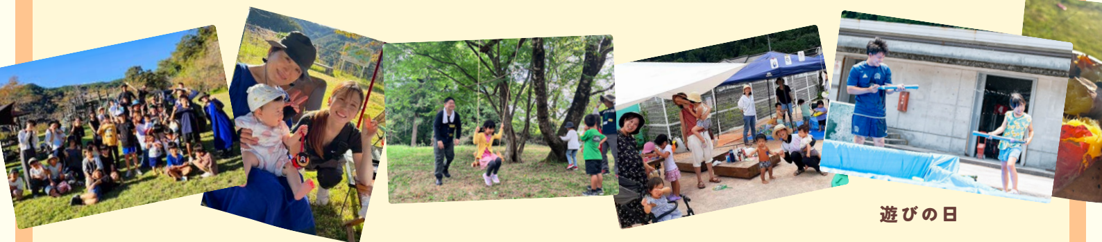
【北房】おそとあそびをするかい