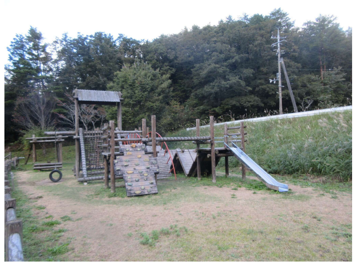
木製コンビネーション遊具