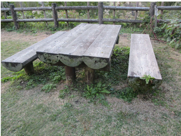
半割ベンチ野外卓交換