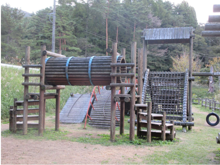
木製コンビネーション遊具