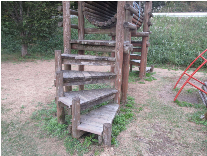
トンネル階段部更新