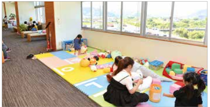
猛暑日に市内を巡回する屋内型の遊び場 本庁舎4階

令和8年度は、猛暑日に市内を巡回する屋内型の遊び場に加えて、既存施設を活用した子どもの居場所の通年