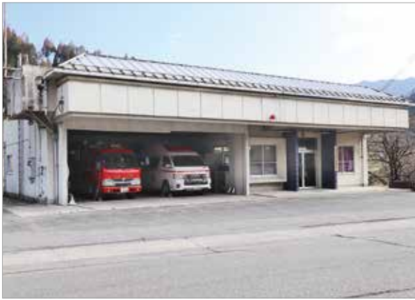
現在の美新分署庁舎 美甘

特別警戒区域内にあることから、新庄村との協議を経て、建て替えが不可欠と判断しました。