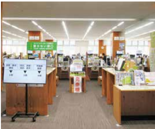
本庁舎の玄関ロビー(窓口案内)