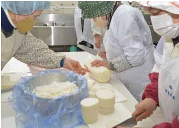
真庭いきいき健康プロジェクト 川上

その結果、身体機能の改善が長期的に維持されただけでなく、健康意識にも変化が見られました。高齢者の健康