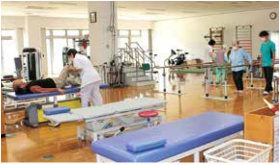
充実したリハビリ環境の湯原温泉病院

令和7年度の地域包括病床の入院単価は36,876円と上昇し、療育病棟の倍以上となる。計算上は1日当たりの入院患者が1人増えると年間1,300万円以上