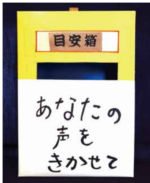
まにわの未来をみんなで考える

しかし、ホームページ上のごとにあるのか分かりづらい、子どもや高齢世代にとっては利用のハードルが高いという課題もあると市民の声としてある。そこで、まにあぶり匿名で利用できる御意見