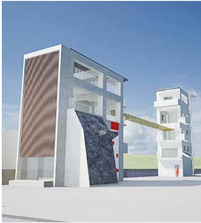
救助訓練塔(完成イメージ)

は5億1,370万円で契約の相手方は、梶岡建設株式会社・鳥越工業株式会社特定建設工事共同企業体です。