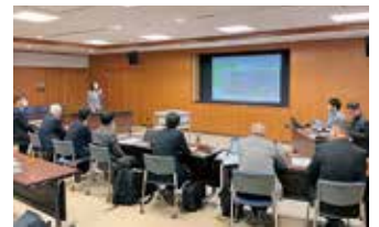
視察の様子 宮崎市

真庭市議会でも、AI等を用いた議会運営の効率化と、市民との関係を構築する仕組みづくりを、小さな工夫から実践します。