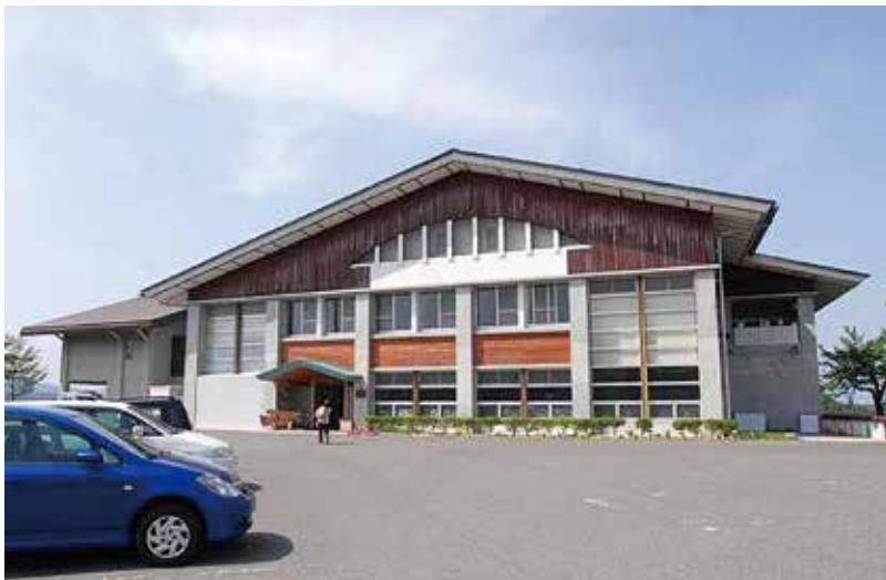
公共施設は今、その在り方の根本的な見直しが必要

そもそも現在の公共施設マネジメントの原則的な考え方自体、何か曖昧で煮え切らないような印象は拭えない。言い換えれば、関係者、それから地元の顔色をうかがって当たり障りのないところで結局は延命措置にすぎないことをやっていきますよというふうにししか思えないところもある。