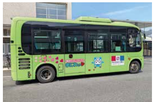
コミュニティバスまにわくん

①まにこいんで全ての行政手数料の決済。②公共施設周辺をシートやコンクリート等で防草施工し、長期的な管理費の削減。③コミュニティバスまにわくんの固定ルートを見直しデマンド型交通で市民の利便性を高める検討。④業績不振の指定