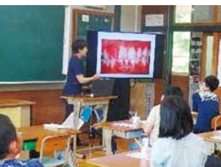
小学校で歯の保健指導

で、真庭市も成人の歯科検診を実施すべきと考える。歯疾患の早期発見・治療による健康寿命の延伸。糖尿病、心血管疾患、認知症等の予防。早期治療につながる。医療費の削減効果があり、国保税の引き下げにもつながる。 ②検診制度は医療費を下げる手段の一つである。