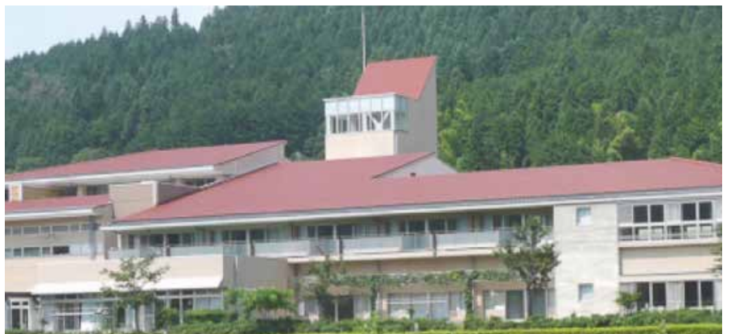
経営改善に取り組む湯原温泉病院

昨年を引き続き、厳しい状況は続いています。年度末の見込みとしては昨年度2億円の赤字から、目標とする1億円の赤字に近づけるよう経営改善を行い、病院全体で取り組んでいます。