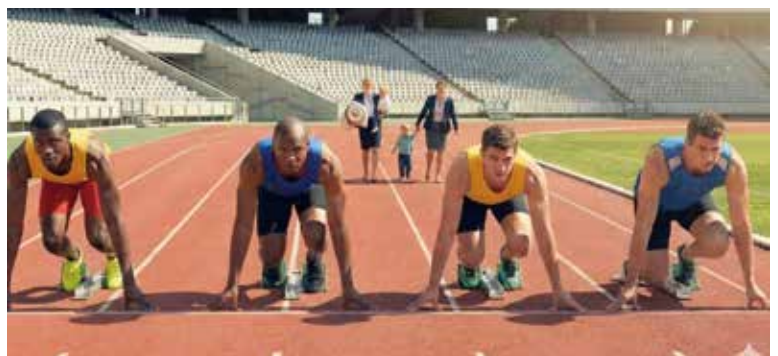
ジェンダーギャップの図 (生成AIで作成)

教員の労働時間は子どもの学習環境である。①本市で教員は労働基準法第34条に定める休憩を取れているか。休憩時間は労働から完全に解放されたものとなっているか。②教員の労働環境は労働基準法に違反していないか。③教員の勤務時間外活動は、文部科学省が言うように教員が勝手にやっている自主的、自発的な活動か。