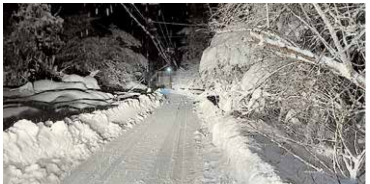
除雪後の道路 蒜山富山根

大雪に対応し土木費を増額 3億1,158万4千円 一般会計 主な歳出(3月補正) 総務費では、定額減税補足給付金事業の減等により3億1,358万1千円を減額。民生費では、生活保護費の減等により3億441万6千円を減額。衛生費では、塵芥処理経常管理費の減等により2億8,516万5千円を減額。農林水産業費では、林道整備事業(林道川上1号線)の減等により1億7,374万2千円を減額。土木費では、除雪経常管理費の増等により3億1,158万4千円を増額。教育費では、スポーツ施設改修等事業の減等により1億3,165万1千円を減額しています。諸支出金では、減債基金積立金及び財政調整基金積立金の増等により9,863万2千円を増額しています。