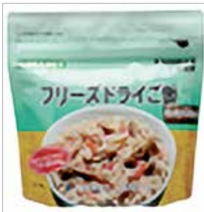
フリーズドライのまいたけご飯

正 解者の中から10人に「フリーズドライ工房まにわ」が当たります。はがきに答えとあなたの住所・氏名を本ページ左欄に記載している真庭市議会までお送りください。当選者の発表は商品の発送をもって代えさせていただきます。締切..5月31日(日)消印有効。前号の応募総数は64通で、正解者は62人でした。ご応募ありがとうございました。