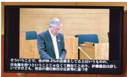
傍聴席に設置した字幕付モニター