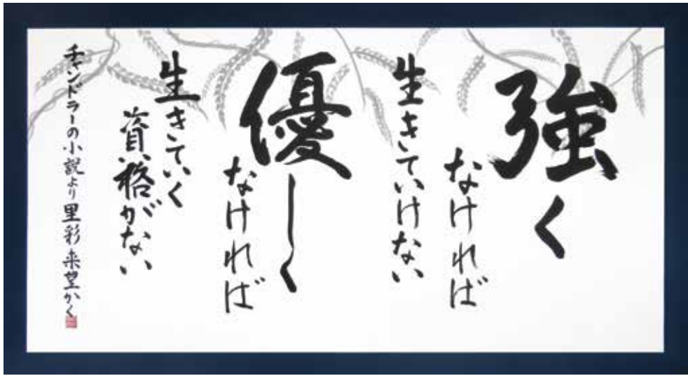
▶チャンドラーの小説より 真庭高校 玉岡里彩 岡崎来望