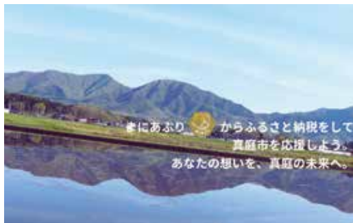
あなたの想いを、真庭の未来へ。 まにこいん専用HPより

自治体・事業者の三方よしを実現し得る。一方で制度が分りにくいという課題もあり、ユースケースや料金シミュレーションを示した提案型の戦略的PRが必要と考える。こうした戦略的PRを行う考えはあるか。