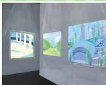
無人の美術館 真庭高校 佐藤仁衣奈