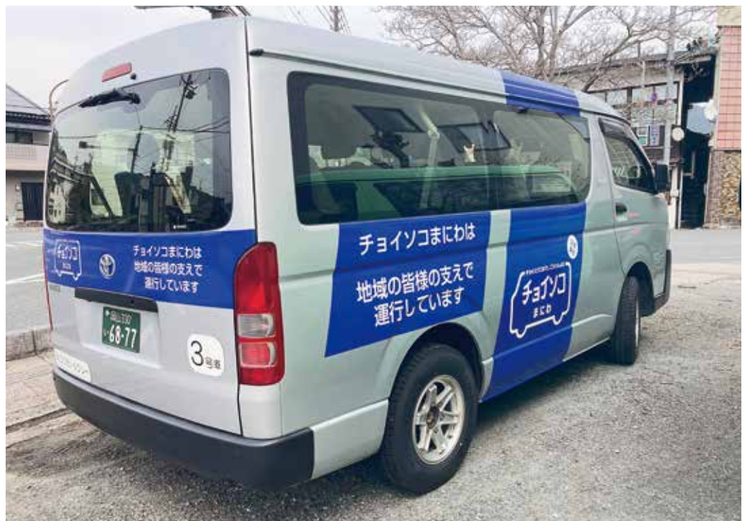
久世、落合、勝山地域で運行されているチョイソコまにわ

本年度策定中の地域公共交通マスタープランでもその地域を課題として位置づけている。チョイソコ、イコデー、二川・津田・中和の地域ではコミュニティバス、それぞれ地