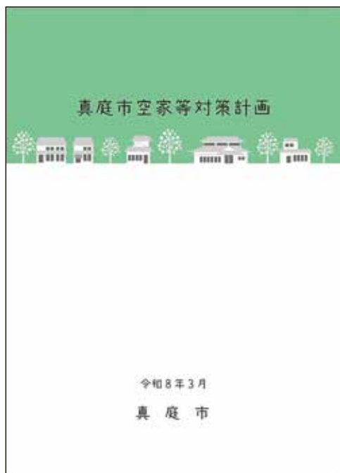
真庭市空き家等対策計画

点的に進めていくとしています。改定した計画は、空き家に関する各種国庫補助金の要件になっており、この4月から公表予定で、計画期間は10年となっています。