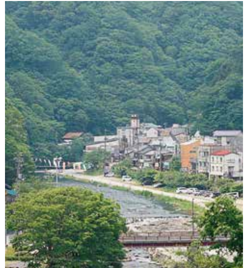
温泉街を南から望む 湯原温泉

また、観光地間の競争は質の面で一段と高度化し、温泉地としての魅力向上が求められる。これからは単に客数を追う時代ではなく、滞在価値を高め、体験の質を向上させ、地域資源を磨き上げること、選ばれる温泉地となることが求められている。そのためには、持続的な自主財源の確保が不可欠である。入湯税の超過税率導入について、改めて具体的な検討を行うべき段階に來ていると考えるが市長に伺う。