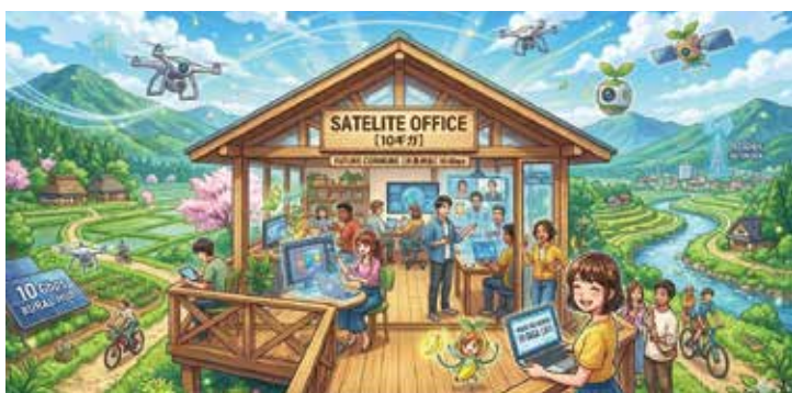
ネットの高速化で「場所の制約から解放された田舎暮らし」 (生成AIで作成)

近隣自治体では民設民営による10ギガサービスの提供が始まっている。テレワーク推進や企業誘致において通信速度は重要だが、今後の展開を問う。