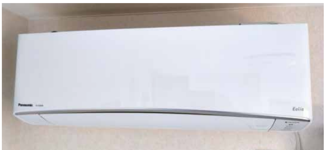
エアコンの設置費用に補助を

うが、令和8年度補正予算、令和9年度当初予算にはエアコンも含めるよう検討すべきと思う。また、今年の夏を乗り切るためにもエアコンの設置補助金を継続してもらえよう、県や国に強く訴えるべきと思うが市長の所見を伺う。