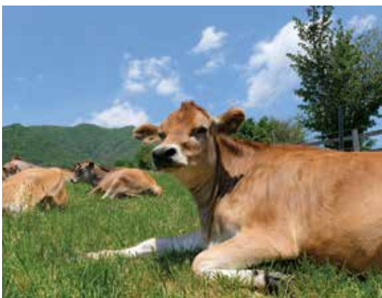
牛糞をバイオガス原料として使用