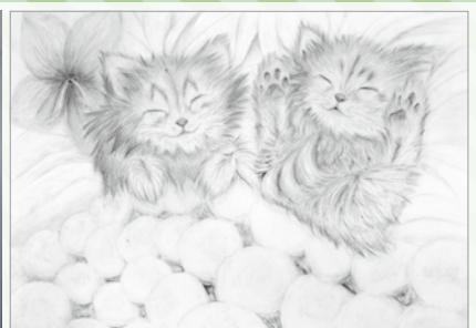
2匹の子猫 勝山高校 西本桃菜