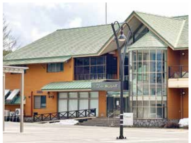
赤字続きで4月から閉鎖される、ホテル蒜山ヒルズ

株式会社アストピア蒜山は、真庭市が出資する第三セクターで、市の出資比率は99.8%、出資金額は6,255万円であり、とても公共性と効率性の両立を目的として官民が共同出資したものとは言えず、市の執行機関の一部といっても差し支え