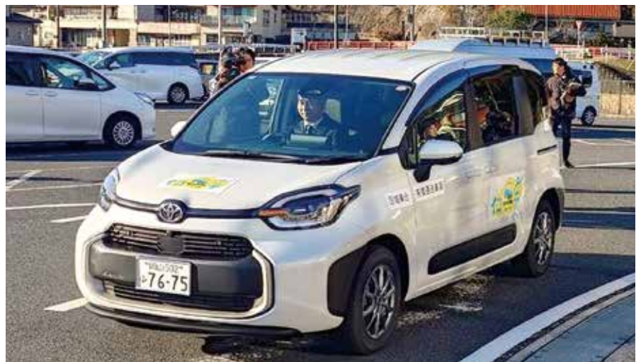
運行を開始した「イコーデ」