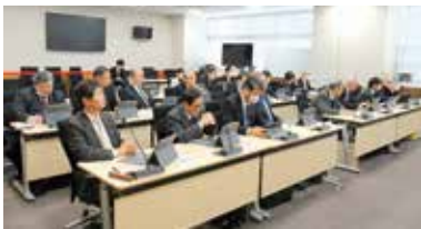
研修の様子 本庁舎4階委員会室