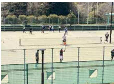
落合総合公園テニスコート

子どもたちのやりたい、挑戦したい、そういう思いを大事にしながら、それが応援される地域社会を学校、家庭、地域と共につくっていくことだと考えている。