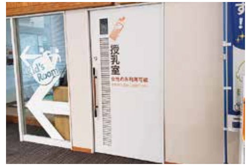
本庁舎1階の授乳室