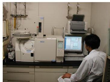
GC/MSによる農薬等類の測定