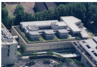
委託水質検査機関：(公財) 岡山県健康づくり財団

もに外部が行う精度管理の評価試験を受けさせ、その結果が「不満足」又は「質疑あり」とされるZ値の絶対値が2を超えないよう、精度のよい測定を行わせるなど信頼性の保証に努めています。