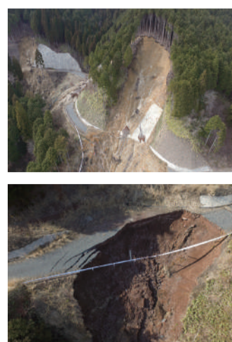
真庭市 林道 作備線 (平成30年7月)

平成30年(2018年)7月豪雨では九州から東北にかけて、広範囲で断続的に非常に激しい雨が降り、西日本各地で平成最悪の豪雨災害とされる甚大な被害となりました。真庭市内でも一部地域で、山腹崩壊や床上浸水等の被害をもたらしました。過去には台風や集中豪雨により、大規模な土砂災害が発生しています。自然災害はいつどこで発生するかわからないため、普段から災害に対する備えや知識を身につけることで、命を守り、被害を最小限に食い止めましょう。