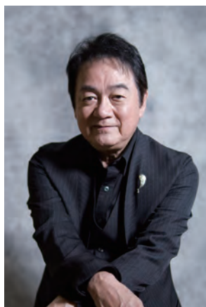
歌手・俳優 岸田敏志 さん きしだ さとし