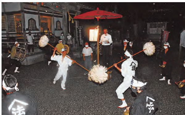
令和4年8月19日付 山陽新聞

県重要無形民俗文化財「吉念仏踊り」が8月、吉の法福寺で行われ、住民らが独特の踊りで先祖の供養と無病息災を願いました。担い手を育成するため、この年から地元の中高校生に呼びかけ、4人が伝統を体験しました。