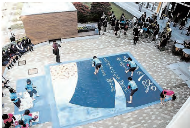
平成23年11月6日付 山陽新聞

勝山高校創立100周年記念でリニューアルした中庭の完成を祝う「中庭芸術祭」が11月に開かれました。中庭にのれんを描いた巨大和紙が広げられ、吹奏楽部の演奏に合わせ、書道部員が白い絵の具で「夢」「青春」などと書いていきました。