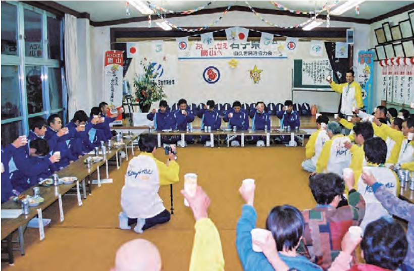
住民あげての民宿歓迎会