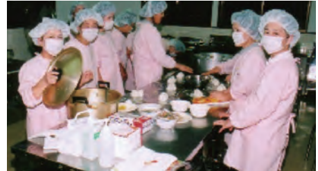
食べ盛り選手のために