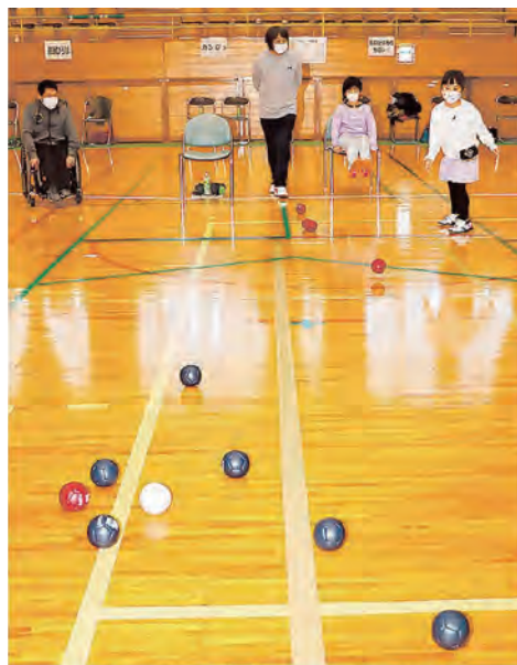
令和4年12月3日付 山陽新聞

障がいの有無にかかわらず楽しめるユニバーサルスポーツ・ボッチャの交流大会が12月、白梅総合体育館で開かれました。ボールを投げて白い目標球にどれだけ近づけられるかを競う競技。7歳から90代までの80人が参加。車いすの人もいて、みんなが競技の魅力を堪能していました。