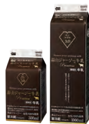
蒜山ジャージー牛乳プレミアム