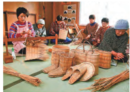
平成20年1月21日付 山陽新聞

600年近い歴史をもつとされる伝統的工芸品の「がま細工」。全国のほとんどの地域では、その製作技術は失われていますが、蒜山地域では脈々と受け継がれています。すべて手作業で仕上げられ、流通量は多くありませんが素朴な民具として土産物などに重宝されています。