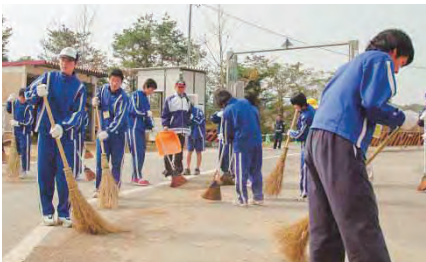
競技会場を清掃する中学生たち

おかやま国体秋季大会は10月、真庭市内で軟式野球、ハンドボール、馬術、山岳等の競技を開催。市内では多くの市民がボランティア、応援、民泊など、さまざまな形で大会を支え、盛り上げました。