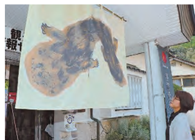
湯原温泉アート（温泉街にのれん）

県北で初めて開催された「森の芸術祭」は9月から約2か月の会期中、約52万人が訪れ、盛り上がりました。真庭市内では蒜山と勝山の展示会場に加え、市民が主体となった久世芸術祭「久世げー」など独自の連携企画や応援イベントが約70件開催され、さまざまな交流や賑わいが生まれました。