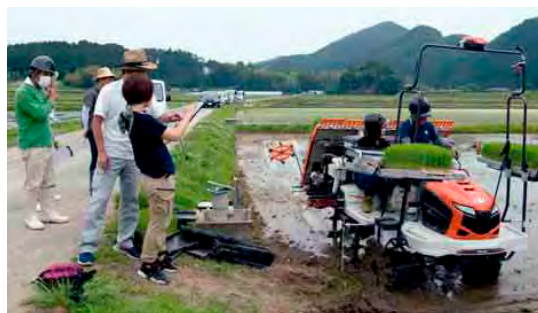
直進キープ田植え機

ITを駆使した先進技術を活用する「スマート農業」の実証実験が、2年がかりで鹿田地区の農事法人寄江原の水田で行われました。直進を維持するトラクターや田植え機、ラジコン草刈り機、農業散布ができるドローンなどの先進機器が導入され、作業時間の3～5時間の削減、収量の1割向上などの成果が得られました。