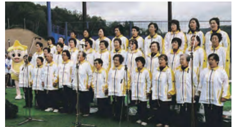
「国体歌」を熱唱する市民合唱団