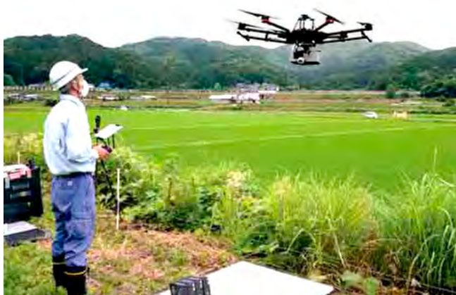
ドローンによる測量