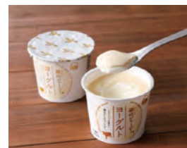
蒜山ジャージーヨーグルト

蒜山酪農農業協同組合の「蒜山ジャージー牛乳プレミアム」が4月、アジア最大級の国際食品・飲料展の「ご当地牛乳グランプリ」で最高金賞を受賞しました。翌年には同展ヨーグルト部門で「蒜山ジャージーヨーグルト」が金賞を受賞するなど高評価が続きました。