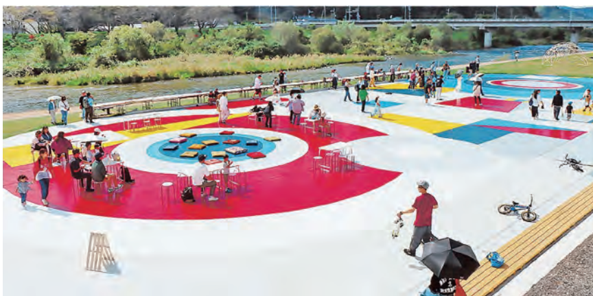
「久世げー」連携企画の床面ミューラルアート