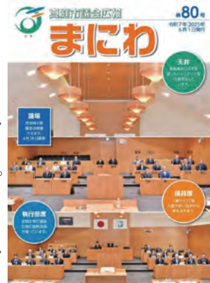
市議会広報「まにわ」80号の表紙

市議会広報紙は、市誕生の5カ月後に「議会だより」として創刊。「市民との懸け橋に」と議会広報編集特別委員会が年4回、委員会報告や一般質問などを掲載してきました。途中、表題を市議会広報「まにわ」に変更、紙面もカラフルに刷新して、20年後の6月、80号を迎えました。