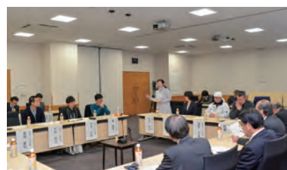
地域おこし協力隊との意見交換会

議会活性化推進特別委員会が掲げた方針により、11月から各常任委員会が市民団体、農協、地域おこし協力隊、猟友会など