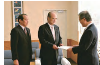
提言書を市長に手渡す正副議長