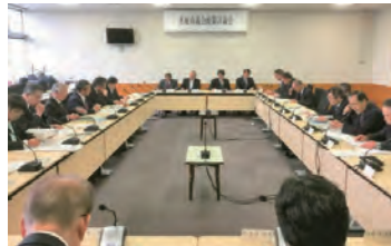
提案を討議する議員

議員全員で議論し、政策提言を目指す初の政策討論会を11月に開催しました。2つの常任委員会からの提案内容に質疑、討議を行い、1案の提言化を決定。その後、練り上げた成案を全員協議会で確認し、12月、市長に提言書を手渡しました。