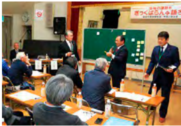
付せん紙を使って工夫する議員

「地域課題をざっくばらんに語ろう」と呼びかけた「議会報告会+市民と語る会」を5月、12小学校区で開催(参加233人)しました。平成25年から続く「地域報告会」(9会場)を刷新。市議が4班に分かれ、各会場で議会報告の後、市民から地域課題や要望などを聞き、意見交換を行いました。