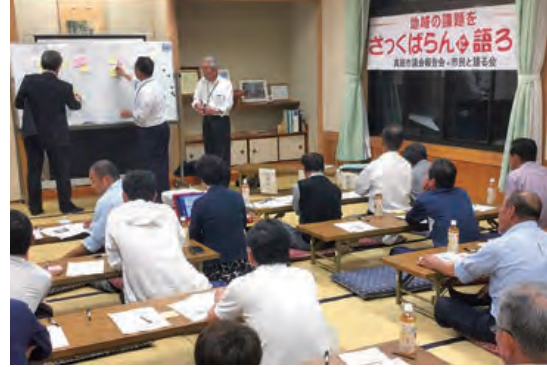
地区の公民館で開かれた語る会