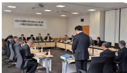
市議会連盟の設立総会

中国横断自動車道岡山米子線全線4車線化促進市議会連盟の設立総会を1月、真庭市役所で開催。沿線7市議会で構成、真庭市議会に事務局を置き、相互に協力して活動することになりました。