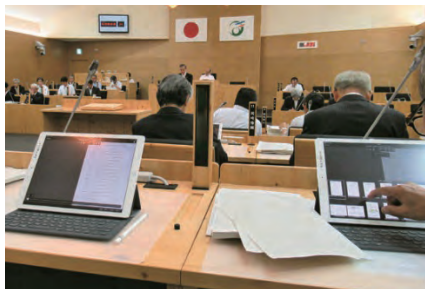
議場に登場したタブレット

12月定例会からタブレット端末を完全導入しました。各議員と事務局職員に計30台を配備し、ペーパーレスを実現しました。