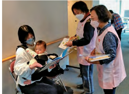
赤ちゃんに絵本を贈る「セカンドブック」事業