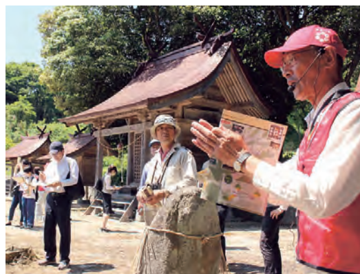
地域の史跡を案内する地元ガイド

湯原温泉郷と連携したり、大手企業のツアーを受け入れるなど、年間600人もの観光客が訪れる地域