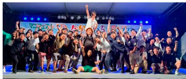
創立60周年記念式典開催（令和5年10月15日）

校生が実際の市議会議場を使い、市長に質問や提案を行う）、ひまわりスポーツフェスティバル（障がいの有無に関わらず子どもたちと一緒に楽しめるスポーツイベント）などの青少年育成やまちづくりなどの事業を行っています。