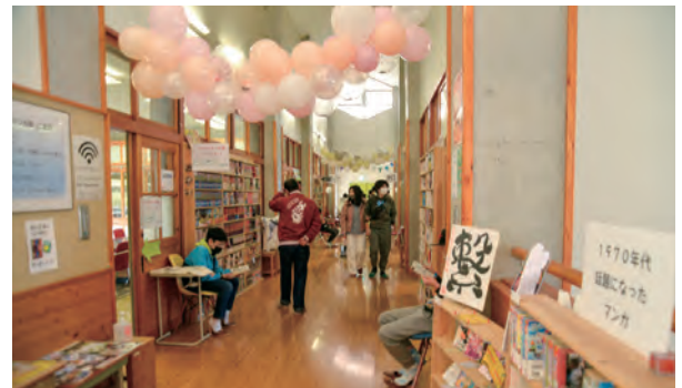
思い思いに漫画が楽しめるマンガ館

ス停留所まで遠いという課題に加え、コミュニティバス「まにわくん♡」の枝線が廃止に。市役所と地域がタイアップして「デマンド（予約乗り合い）交通」をスタートさせ、いまや地域住民の足になっています。