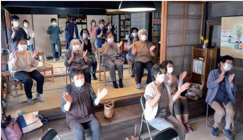
体操やおしゃべりで心身ともにリフレッシュ