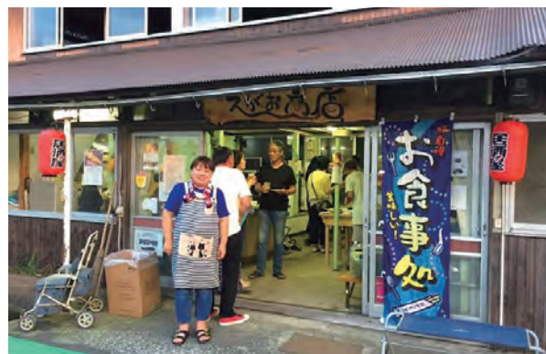
みんなで空き家を修繕した「えがお商店」

子どもたちが集まる場所を作りたいと考えた塾生たちは、地域や地域の学校応援団「中和いきいきサポーターズ倶楽部」等に呼びかけました。みんなで資金を出し合い自分たちの力で修繕をしました。平成30年に完成。子どもたちが「えがお商店」と名付けました。そこにはまさに「地元住民、移住者ごっちゃまぜ」の風景があります。