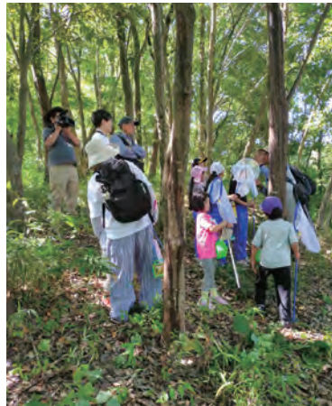
子どもたちが夢中になる体験活動

「ボランティアだからこそできることがあると思うんです」。地域で子どもたちを育てていくという思いがあるから、ボランティア団体として続けてきました。落合の子育てを支えています。