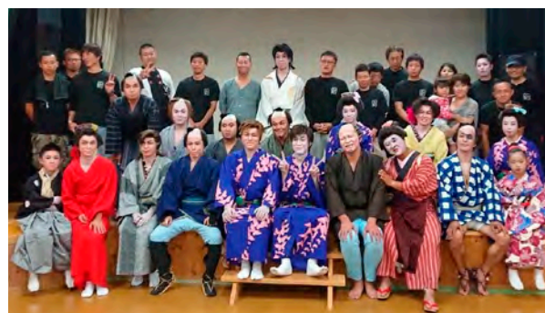
世代を超えて繋がる一座のメンバー