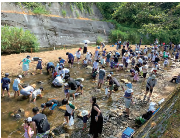
大勢でにぎわう魚のつかみ取り

二川の清流を活かしたイベント「魚のつかみ取り」は毎年、二川の人口を超える300人以上が参加。また伝統野菜「土居分小菜」の継承や活用を大学や研究機関と連携しながら進めています。谷ごとに集落が分かれているため、どの集落からも最寄りのバ