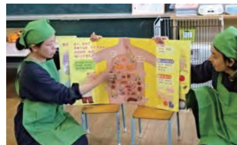
保育園では大型絵本で分かりやすく説明