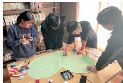
自分たちで「やりたいこと」に取り組む子どもたち