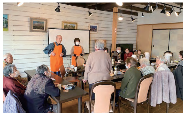
キャラバンメイトが運営するオレンジカフェ

平成26年10月、市内で8カ所の「オレンジカフェ（認知症カフェ）」が月に一度開催されるようになりました。カフェではキャラバンメイトとサポーターの皆さんを中心に、地域の方が誰でも安心して集ま