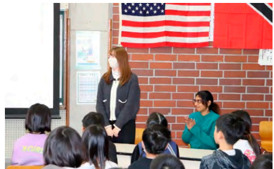
小学生とALTとの国際交流会

このほか、地域団体に引き継がれた真庭武道祭に協力し、さらに落合総合公園の清掃活動にも参加するなど、幅広い奉仕活動を展開しています。