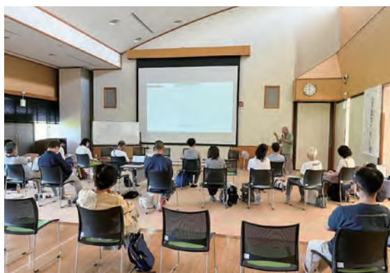
第6期基礎講座の会場。塾長らの講義や住民を交えてのディスカッションなどが行われました

者に移住してきてほしいとの思いを語り、結果、移住者は「入る作法」、地元住民は「受け入れる作法」を学んでいきます。