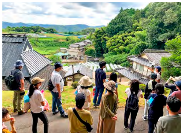
北房地域で「地元学」のフィールドワーク。住民の案内で集落を歩き、固有の風土や生活文化に触れます

令和3年、なりわい塾は北房地域でも始まり、その灯は市内各地に広がっていきます。令和6年度までのなりわい塾は8期を迎え、卒塾生は171人、その中で移住した人が19人、また卒塾生の半分以上が卒塾後も真庭市と関わっています。なりわい塾は、市内の「ひと」と「ひと」をつなげ、そして全国へもつながっていきます。