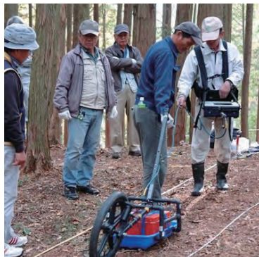
住民との共同作業で行われた 地中レーダー探査

北房には250基を超える古墳があります。古墳時代前期から終末期まで首長墳が続くという他地域では見られない特色もあります。その中でも最も古い荒木山東塚・西塚古墳の保存活用に取り組もうと平成28年(2016年)、「荒木山の古墳を顕彰する会」が地域住民を中心に発足。