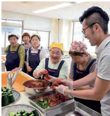
キムチ作りで女性たちと交流する隊員