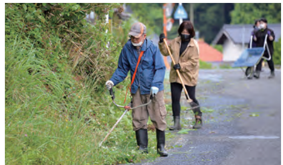
市道の草刈りや清掃を行う住民

令和4年（2022年）、真庭市は新たな制度を創設しました。「道路愛護団体」制度の創設です。自治会、青年会、また任意の団体を対象に、有償での市道管理を呼びかけたのです。この仕組みは大きな反響を呼び、令和7年度には約211団体が登録し、約4,200人