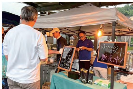
「美甘deのみ〜の」の店頭風景。各店舗は飲み物と食べ物のセットを用意し、参加者は共通チケットで支払い、複数店舗を飲み歩くことができます