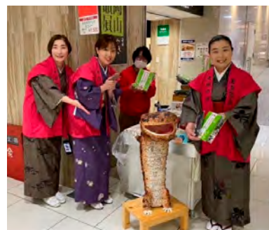
岡山市のデパートで「おかみちゃんカレー」の試食販売

練習を重ねた女将たちが息を合わせてベルを振り、各地のイベントや福祉施設、保育園などで披露しました。また、温泉指南役としての観光案