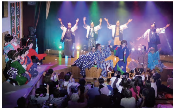
客席と一体となって盛り上がる会場

のないものになっています。また、新たな取組として、地元の美川小学校の子どもたちにソーラン節や太鼓も教えています。教わった子どもたちが、本番の前座を担当。そしてまた、そんな子どもたちが次を担う世代へ。「焼芝一座」は地域の誇りであり、人と人を繋ぐ大切な居場所です。