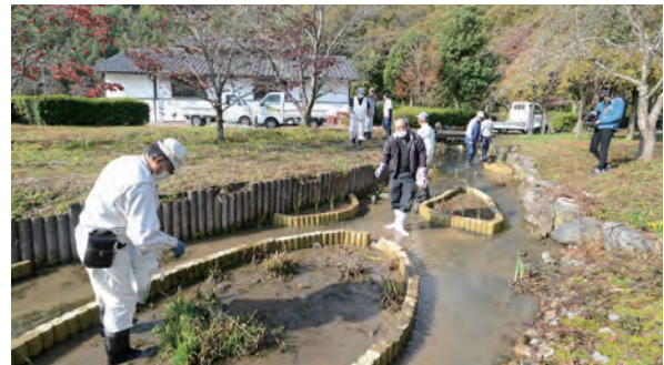
ヘイケボタルを増やすため「北房ほたる公園」の水路にハナショウブを植栽

現在の活動内容はこれまでの草刈りや遮光幕設置に加えて、水温、水質分析などの定期測定や生息分