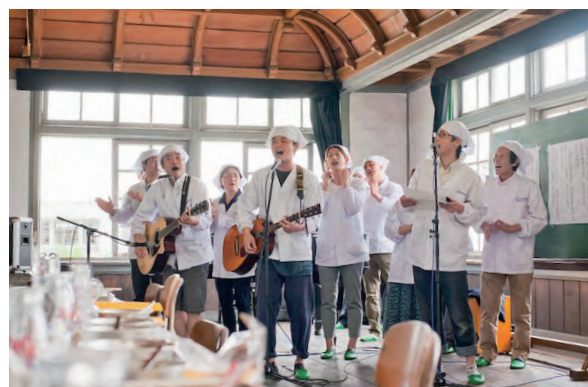
音楽とトークで会場を盛り上げる「配膳ボーイズ」

さらなる利活用を目的として「旧遷喬をゆたかにする会」も発足。校庭を使った年越しイベントなど、「危機感よりも楽しさを原動力にしたい」と新たな取組も生まれています。多くの人の手によって、この校舎は今もなお育まれています。