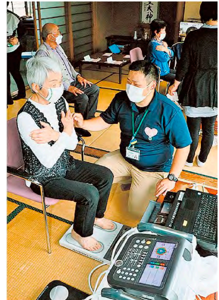
令和4年7月27日付 山陽新聞 参加者の筋肉量などを最新機器で測る市職員