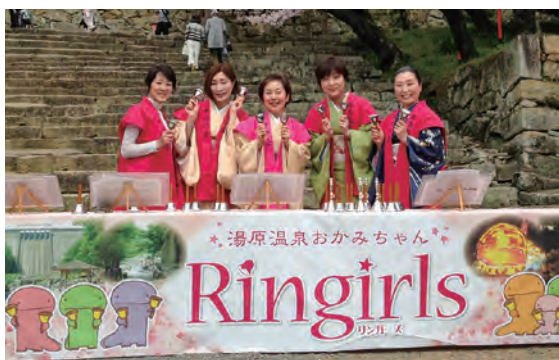
各地のイベントでハンドベルを演奏する女将たち

大きな話題となったのは、平成の初めから10年以上続いた女将たちによる「ハンドベルの演奏」です。