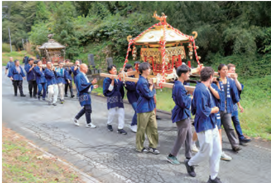
式内社の秋祭りで神輿を担ぐ大学生たち

となりました。空き家を改修した、滞在も可能な交流拠点「神戸の館」には多くの利用者が訪れるようになり、また岡山県内の大学とも連携を深め、「社祭り」「竹あかりイベント」や、特産品「やしろ餅」の販売も進めてきました。