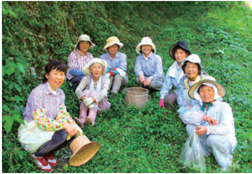
薬草を採集するクラブ員たち

いうことを知ってほしい」というモットーのもと、「やまんばあば」という愛称で、勉強会や料理教室を重ね、平成26年には地域産品として「くず新芽茶」の販売を開始しました。