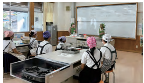
子どもへの食育活動（郷土料理けんぴき焼きの紹介）

おいしいものを食べると人は「笑顔」になります。その「笑顔」が食育推進ボランティアの活動を支えています。市民が今もこれからも心身共に健康であることを願い、自らが楽しみながら食を通して「笑顔」の輪を広げていきます。