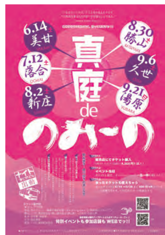
令和7年に開催された「第16回のみ〜の」のポスター

こには地域振興という言葉に収まらない、お互いを認め合い、地域も世代も関係なく関わり合っていく「共生社会」の姿があります。