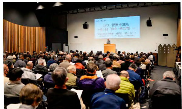
山中一揆をテーマにした初回の歴史講座（令和7年3月）。一揆の勃発から300年（令和8年）を記念し、顕彰会と市が計8回の講座を計画、一揆の実像を後世に伝えています

地元映画監督による山中一揆をテーマとした映画『新しき民』や、図書館企画などの後押しもあり、山中一揆ツアーや歴史講座、演劇、音楽と活動の幅を広げています。「義民の顕彰を大切にしながらも、こだわり過ぎず、多角的な視点を大切にしたい」という言葉どおり、さまざまな切り口を用いて、歴史文化を後世に伝えています。