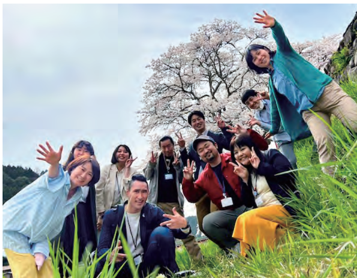
互いに情報交換しながら絆を深める隊員たち

協力隊を迎えて10年余り。さまざまな取組や交流によって各地域の人、さらに地域の枠を超えた若者たちと融合し、まちづくりの化学反応の一翼を担っています。