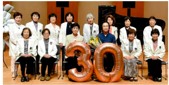
国際ソロプチミスト真庭認証30周年記念行事 (令和6年5月12日)

「国際ソロプチミスト真庭」は、平成6年（1994年）6月に設立。具体的な活動の主なものは、ソロプチミスト花壇の設置、地域への情報発信のためのチャリティトークの開催やぼっこう祭出店、ガールズサミット（女子高校生のためのキャリアサポート）への参加などです。