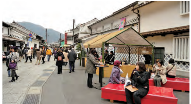
お雛まつりの人出でにぎわう風情ある町並み

がった「NPO法人勝山・町並み委員会」も、醤油蔵を改装した勝山文化往来館「ひしお」をオープン。人とアートが交流するスポットとなり、アートによるまちづくりも進めてきました。結果、勝山町並み保存地区には古民家や蔵などを活用したカフェ、ギャラリーが軒を連ねています。住民が口を揃えて言うのが「勝山の人たちの暮らしがあって、そこに