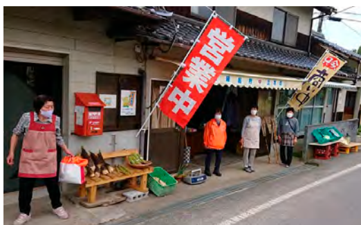
農産物などの売店に改修された立寄処

「吉縁起村」が空き家の改修を手がけた「立寄処」をはじめ、月刊で発行の「縁起村新聞」も創刊から70号を迎え、住民同士のコミュニケーションを生むきっかけになっています。「メディアに取り上げられるたび、地元がより一層好きになった」という声も聞かれ、令和7年にはさらに広域の連携を深められるようNPO団体に。活動の幅を広げながら、住民一人ひとりが主役になれる取組をしています。