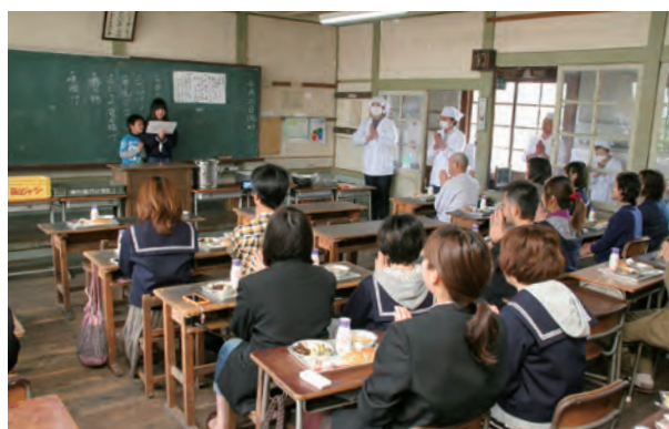
昭和にタイムスリップする「なつかしの学校給食」

その後、校舎の利活用が課題となる中、平成24年頃から始まった「なつかしの学校給食」がさらなる