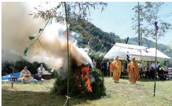
犠牲になった義民を慰霊する護摩供養

「義民の丘」まわりの草刈りも欠かさず、毎年5月の「義民祭」では護摩供養を中心とした慰霊行事を継続。平成7年には「第3回全国義民サミット」を開催しました。今も真庭市内には弥治郎獄や痛まし