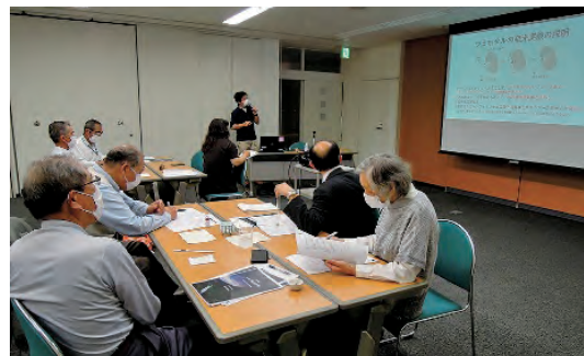
「ほくぼうホタル学」の講座風景