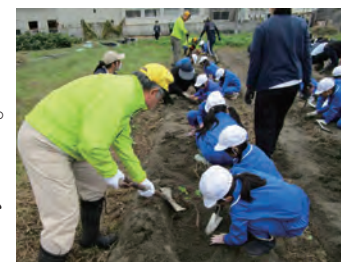
子どもたちとイモ掘り作業

活動、市社会福祉協議会と「災害時におけるボランティア支援に関する協定」を締結し、災害に備える活動や発生後のスムーズな活動が可能な体制づくりです。また、各クラブの会長スローガンのもと、独自の活動も行って