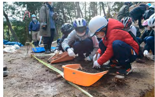
地元の小中学生も発掘調査を体験

真庭市の後押しや同志社大学との連携もあり、三次元測量やレーダー探査など、墳丘の測量や調査を実施。そして令和3年、会の名称を「北房文化遺産保存会」と改め、活動範囲を北房全域に拡大しました。そして「西の明日香村コンソーシアム」を組織し、民学官が連携して、住民参画型の発掘調査に乗り出しました。通常の発掘調査は行政が主導で行いますが、ここでは地元の小中学生・PTAから市内外の一般公募者まで、多岐にわたる方々が発掘調査