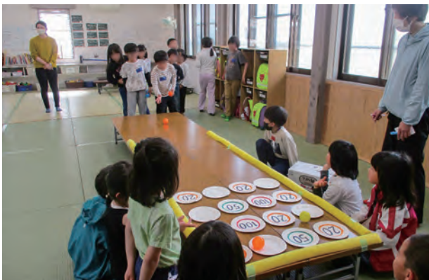
放課後児童クラブで和やかに過ごす子どもたち

ところが、「放課後児童クラブ」を設立するための市役所との交渉などは自分たちでできても、昼間の子どもの面倒は自分たちでは見られない。そんな悩みに答えてくれるのが支援員や補助員たちです。子どもたちが安全に放課後を過ごせるように見守り、生活等の指導をしてくれます。子どもたちは、学年を超えて遊びの中から社会性を身につけ、元気に育っていきます。