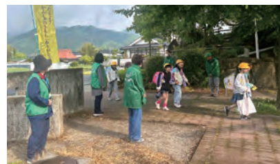
民生委員のあいさつ活動