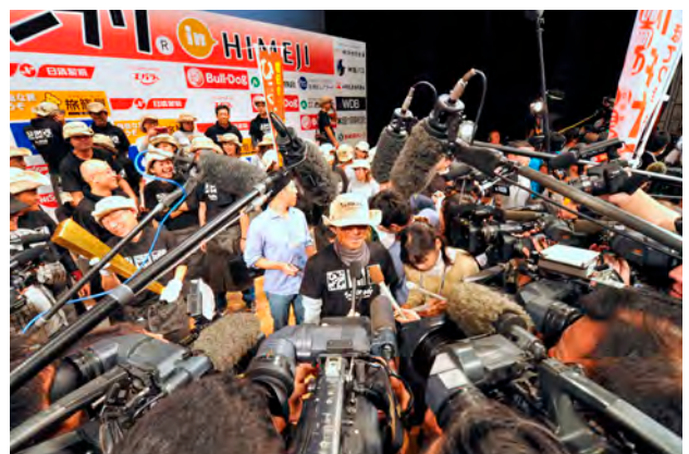
ゴールドグランプリに輝き、テレビカメラやマイクに囲まれるメンバー

蒜山の保存食文化から生まれた味噌ダレによって根付いた蒜山独自の「ひるぜん焼そば」。地元の食堂が発祥とも言われ、やがて「この焼きそばで地域おこしができるのではないかと地域が盛り上がり、平成20年（2008年）に「ひるぜん焼そば好いとん会」が生まれました。平成22年「第5回B-1グランプリ」において、初出展にも関わらず全国2位に。