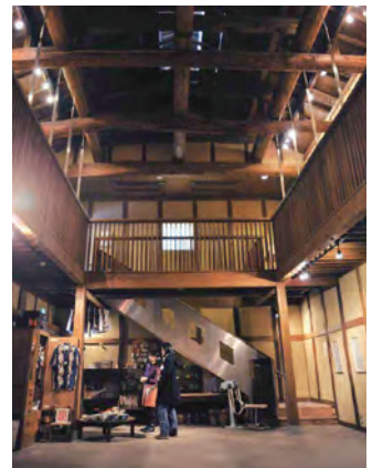
アートをはぐくむ交流拠点 勝山文化往来館「ひしお」

観光がある」。暮らしと観光が共存しています。現在では若者による「勝山・町並み会議」もでき、さらに重要伝統的建造物群保存地区の指定も視野に、幅広い世代による新たな文化のまちづくりへの挑戦が始まっています。