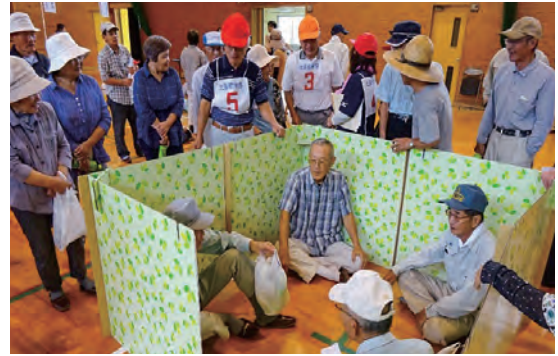
自主防災組織の避難所開設訓練

別の地区では、避難時に手助けが必要な人の名簿を独自に作成し、さらに災害時に避難場所に誰が誰を連れていくかなどを決めた独自の避難プランを作成している自主防災組織もあります。「災害時は、