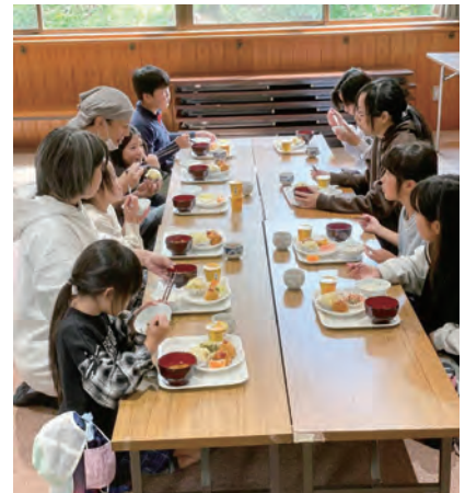
ボランティアが協力する子ども食堂