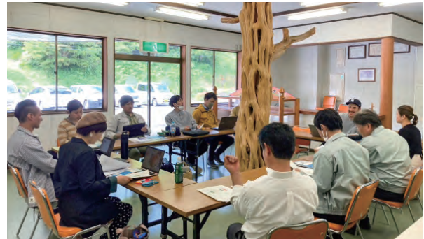
毎月2回、各地で開く移動協力隊会議。 活動報告や情報交換を行います

そして隊員たちは、各々が挑戦したい分野と地域課題を結びつけながら、さまざまな活動に挑戦。これまでの事例をみると、自然再生事業、映像を使っ