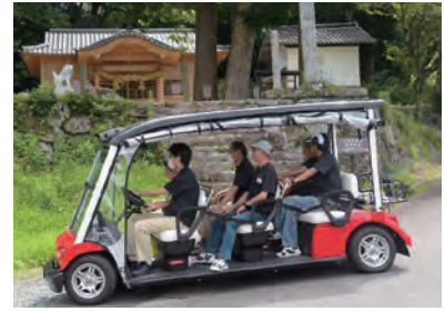
観光客や住民に活用されるグリーンスローモビリティ

高齢化対策では県北でもいち早く電動車を活用した「グリーンスローモビリティ」を導入。観光だけではなく、生活環境に