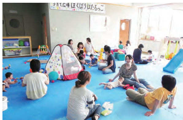
広く明るい広場でのんびり過ごす親子