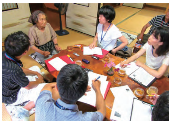
地域のおばあちゃんから「聞き書き」する塾生

塾生が、あるおばあちゃん宅を2回目の『聞き書き』で訪れました。おばあちゃんは小さな折鶴を手渡します。塾生の「ありがとう」の声に、ぽつりと「ともだちじゃけえ」と答えました。おばあちゃんは、自分の人生を聞いてくれる人がいることに深く感動し、その感謝の意を折鶴に託したのです。地域と塾生が繋がっていきます。