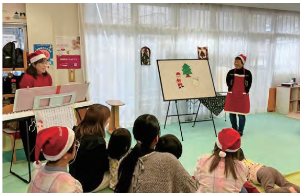
歌やお話で楽しむクリスマス会

参加しているお母さんにお話を聞きました。「結婚後、市外から引っ越してきて知り合いがいなかったのですが、乳児健診の時に勧められ、つどいの広場に参加しました。そこで多くの友だちができ、今