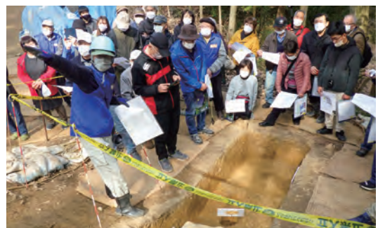
保存会員らが解説した発掘調査の現地説明会。 県内外から考古学ファンが詰めかけました

「自分たちの故郷には古墳という誇れる文化遺産があります。私たちはそれを繋いでいく役割。次世代に継承できたらと思いつつ、知恵を出し合っています」。小中学校での郷育、広報紙「荒木山通信」の発行、案内看板の設置やガイドの養成など、積極的に活動しています。