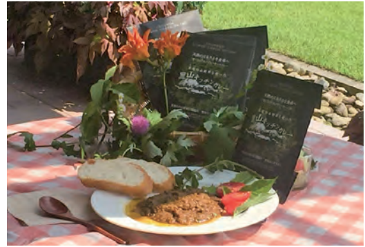
薬草カレーの「里山キッチンカレー」

また、平成29年には「全国薬草シンポジウムinまにわ」を開催。さらに同年、薬草カレー「里山キッ