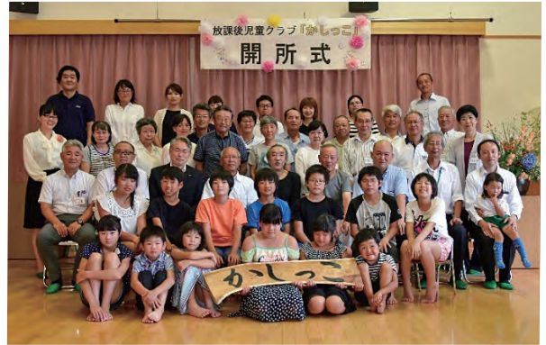
地域の人に支えられて開所した放課後児童クラブ

令和6年（2024年）4月時点で、市内に「放課後児童クラブ」は17施設あります。通っている児童数は約570人。小学生の約3分の1が通っています。市役所も運営補助にとどまらず、できるだけ学校施設内でクラブ運営ができるようにと空き教室の改修や校内にクラブ専用施設を新築するなど、環境整備に力を入れています。