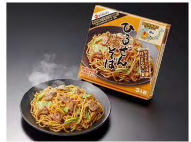
家庭で楽しめる公認商品 「ひるぜん焼そばセット」

企画を手がけ、それぞれで得た売上は「地域のために使おう」と還元。地域経済に大きな波及効果があったと言われています。「食を通して、子どもたちの郷土愛が育まれたら」と学校での講演、学校給食への提供も積極的に行い、「食」をテーマに真庭の地域づくりを支えています。