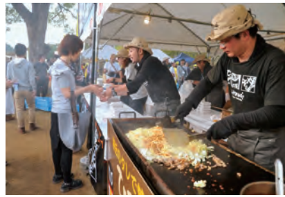
各地へ出向いて自慢の味をふるまうメンバー

イベント出展のほかにも「ひるぜん焼そばのタレ」の開発や、大手企業とのコラボ商品など多くの