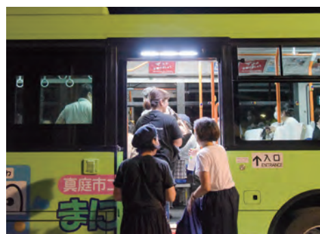
他地区への移動にはコミュニティバス「まにわくん」を利用、帰りは臨時夜行便が運行されます