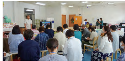
民生委員の研修会