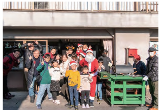
中高校生が発案したクリスマス会。 地域の人も加わりビザづくりなどに挑戦

拠点は少しずつ広がっており、勝山にある中央図書館でも「出張まあぶる」を定期的実施。真庭全体で子どもたちの居場所を整えていく仕組みづくりに挑戦しています。