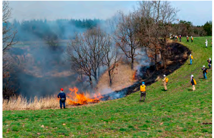
ボランティアの協力で行う春恒例の山焼き

草原及び周辺湿原」として自然共生サイトに認定され、民間企業などとともに、自然環境の調査や研究にも着手しています。