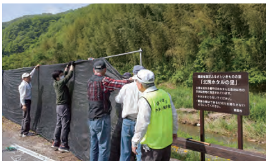
人工的な光からホタルを守るため遮光幕を設置

また、最新のホタル研究を一般参加者にも分かりやすく伝える「ほくぼうホタル学」も令和3年から実施。ホタルに興味を持つ人が増え、市外も含めて会員数の増加に繋がっています。県内外から多くの観賞者が訪れる全国有数のホタル生息地を支え、地元住民の誇りとなる活動を続けています。