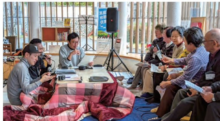
中央図書館の図書館ラジオ「まにわ校歌ジャンボリー」で進行役を務める隊員たち