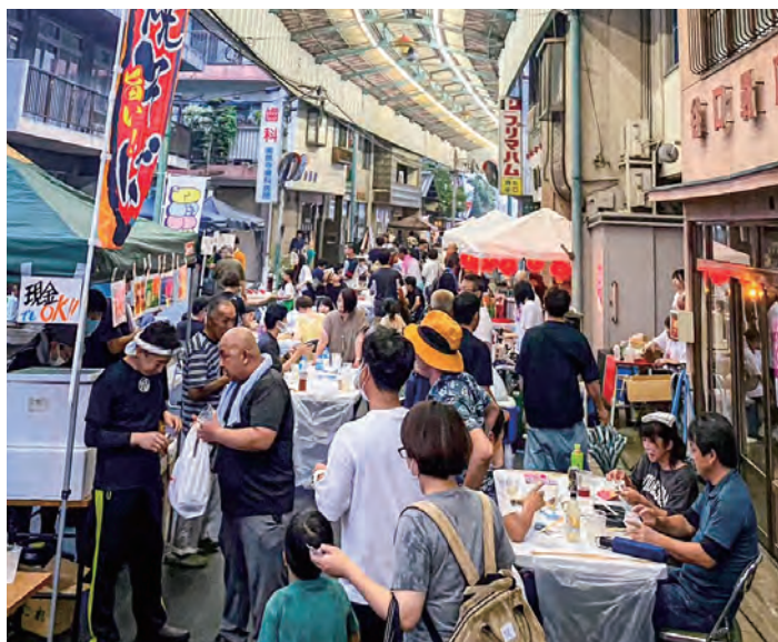
出店が並び、大勢でにぎわう「落合deのみ〜の」。各地域ごとに順次開催され、参加者は市内全域から集まります