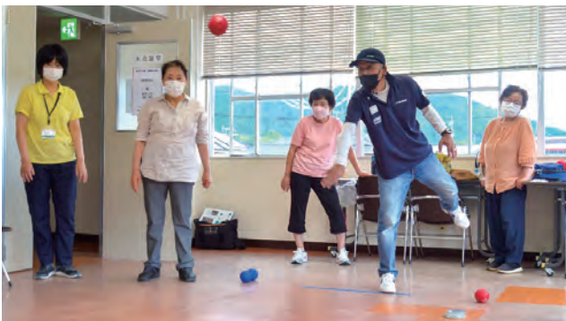
だれでも楽しめるスポーツ「ポッチャ」も人気