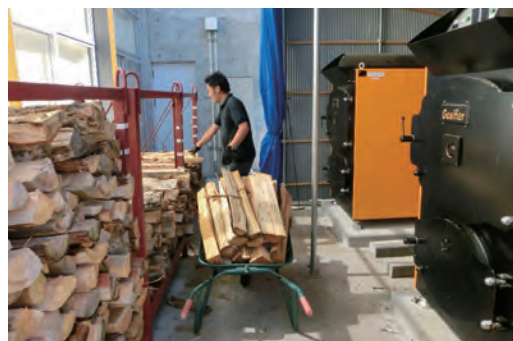
ボイラー（右）の燃料用に収集した薪の準備作業