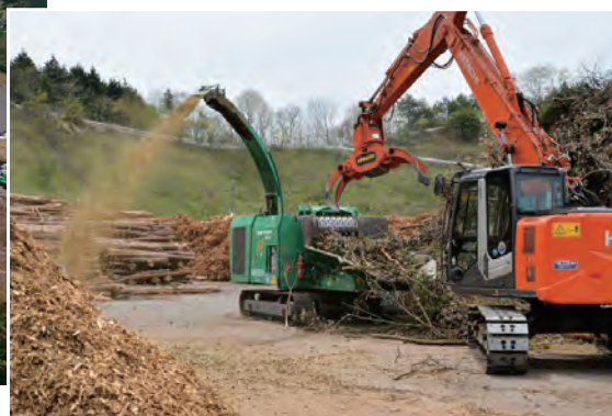
集積基地でチップ化される枝葉