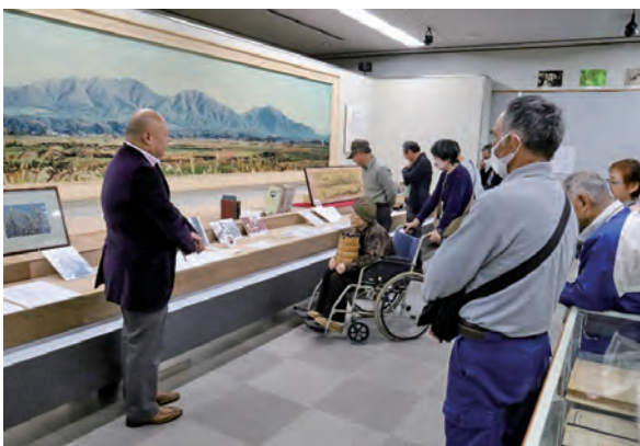
蒜山の先人2人にスポットを当てた企画展

土品、古風な形式を残す大宮踊、地域における技術の結晶である郷原漆器等を常設展示し、また歴史的景観や生業、芸術文化等を再評価した企画展を開催するなど、蒜山地域の歴史の流れを肌で感じることのできる博物館です。そして今、当館の調査により、埋もれかけていた真庭のある歴史に光が当てられることになりました。それは、真庭と戦争（第2次世界大戦）との関わりです。