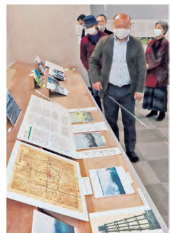
令和3年6月13日付 山陽新聞

昭和10年（1935年）から終戦までの約10年間、蒜山地域に当時日本一の広さを誇る「蒜山原陸軍演習場」が置かれました。蒜山地域では陸軍向けの産業も興り、住民にとっては現金収入を得る点では有益だった一方、日常生活への規制が強いら