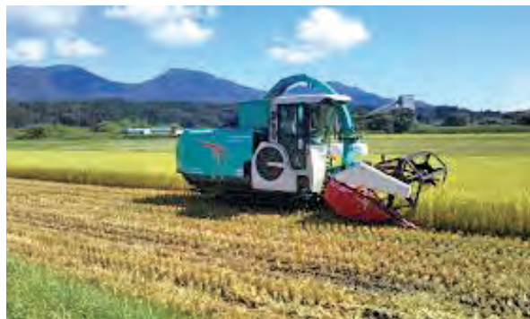
受託した農地の稲刈り作業

令和6年、本格出荷が始まりました。特に主力となる新品種オーロラブラックは、そのおいしさと、他のブドウ販売が終わる10月に売り出されるため大変な人気で、関西を中心に販路拡大が図られています。