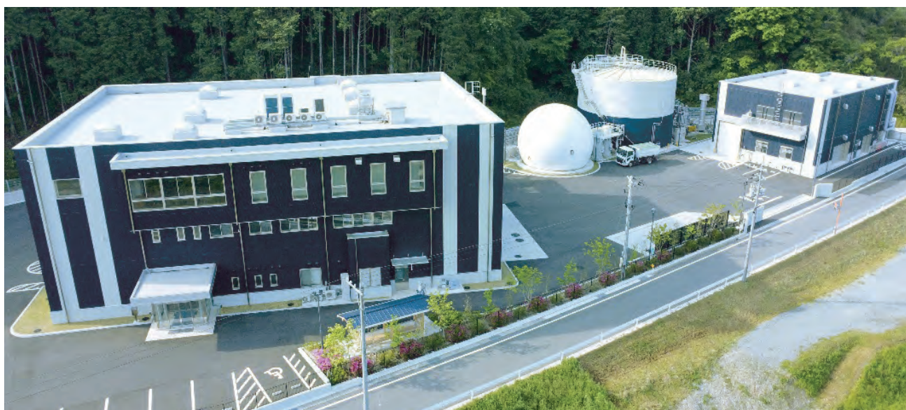
真庭市くらしの循環センター「まにくるーん」の全景。左手が生ごみ等資源化施設、白い球体がガス貯留槽、その右隣がメタン発酵槽、右端がバイオ液肥濃縮施設

焼却場が1カ所に統合されることにより燃えるごみを約40%削減、温室効果ガスの大幅な減少に寄与することになりました。同時に年間約800トンの液体肥料が製造され、循環型農業の拡大に向けて動き始め