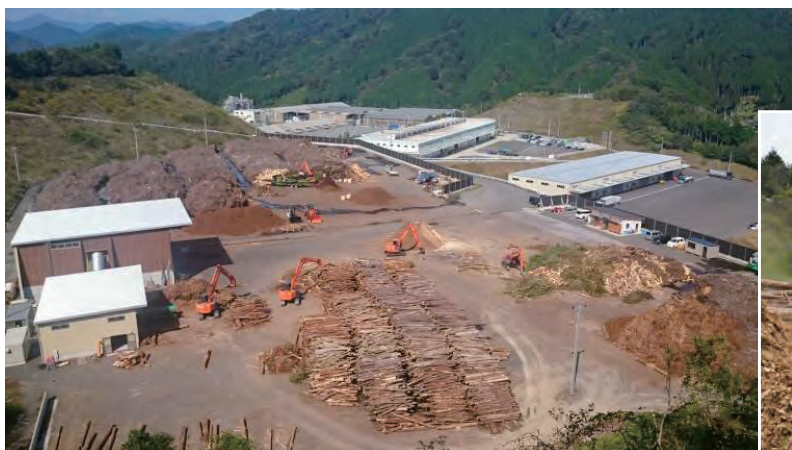
発電所近くに整備された真庭バイオマス集積基地第2工場

太陽光・風力・水力・バイオマスなどの再生可能エネルギーで発電された電気を一定の価格で電力会社が買い取ることを国が義務付けた制度。