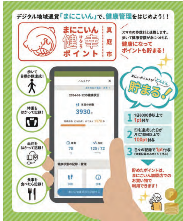
健幸ポイントのリーフレット

利用者数は目標を上回り、同年3月末時点で2万人を突破、人口のほぼ半数に達しました。加盟店は229店、総流通金額は1億7,478万円になりました。