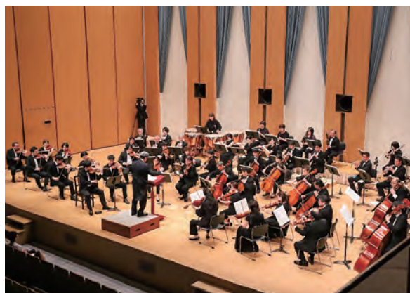
エスパス管弦楽団20周年のコンサート

真庭市発足後は、市内全域をカバーするケーブルテレビ「MIT（真庭いきいきテレビ）」の指定管理を受託し、平成24年「公益財団法人真庭エスパス文化振興財団」と改称。文化振興事業も日本最高水準の音楽ホールであるエスパスホールの活用のみならず、近年は市内最大規模の文化ホールである「勝山ポンテホール」の舞台管理や、それ以外の市内ホールでも文化公演開催などを実施。通常市内では触れることのできない多様な文化に子どもから大人まで幅広く触れていただこうと、設立以来およそ28年間で900回を超える公演を主催してきました。