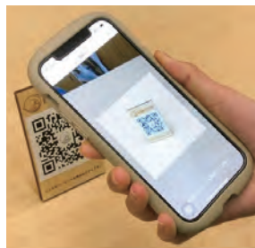
店舗のQRコードで決済