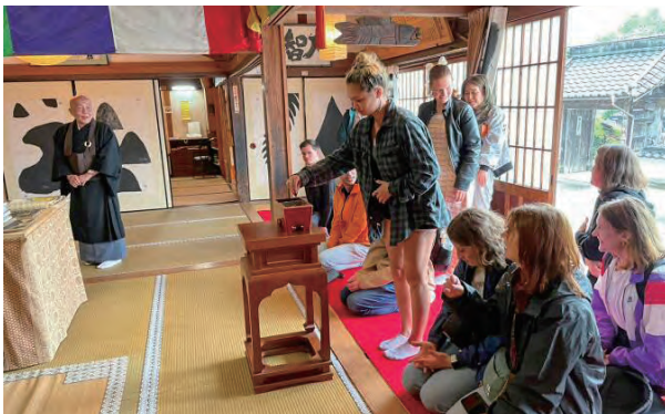
「旅僧まにわ」の企画で修行体験をする留学生