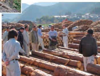
丸太の市が開かれる原木市場