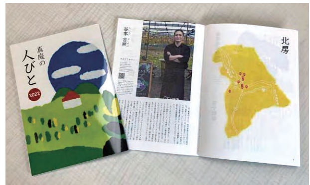
88人の魅力的な人を掲載した「真庭の人びと2022」

ツアー以外の企画としては、個人でも真庭の魅力的な人に会いに行けるガイドブック「真庭の人びと2022」を発刊しました。「ひと」の魅力に触れようと個人でも真庭を訪れる人が増えています。さらに、市内6エリアで順次開く飲み歩きイベント「真庭deのみ〜の」を開催するなど、地域の稼ぐ力を支援しています。市民ならではの視点を生かした多くの企画が展開され、新しい地域価値が創り出されており、真庭の「ひと」や「まち」の再評価に繋がっています。