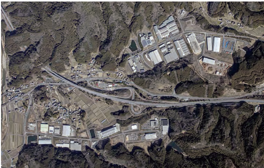
真庭産業団地の全景。北区域（右上）と南区域（左下）に分かれ、その間にあるのが米子道の久世IC（令和3年2月撮影）

「会社の海外事業の関係から立地を大阪か真庭で悩みました。量産体制を図るため真庭に立地しました。真庭の人には、人情が厚くへこたれない、地味だけどやり遂げる底力を感じています。真庭の人と共に会社も成長していきます」。