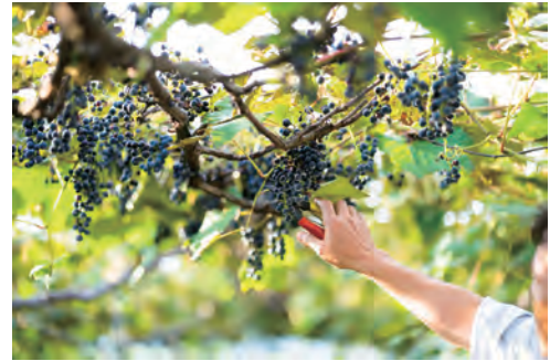
糖度が高く、酸味が少ない蒜山産のヤマブドウ

これらの経営努力が実を結ぶ時が来ます。平成30年、アジア最大のワイン審査会ジャパン・ワイン・チャレンジで金賞を受賞。地域おこしの枠を超え、日本のワイン界に確固たる地位と多くのファンを獲得していきます。