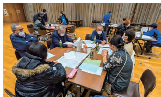
地区助けあい会議。福祉委員らと見守り活動などを協議

また、地区社協内で世代を越えた住民同士の交流活動を進め、地域のつながりを作る活動に取り組んでいます。身近な場所で気軽に集い、交流できる場である「ふれあい・いきいきサロン」は204サロンとなり52%（439自治会）で活動が広がり、年間延べ3万