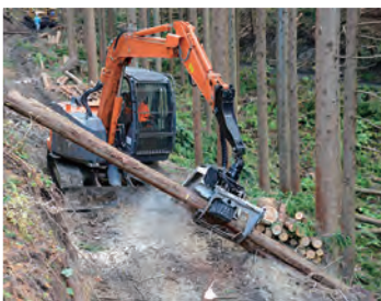
機械化が進んだ森林での伐採風景