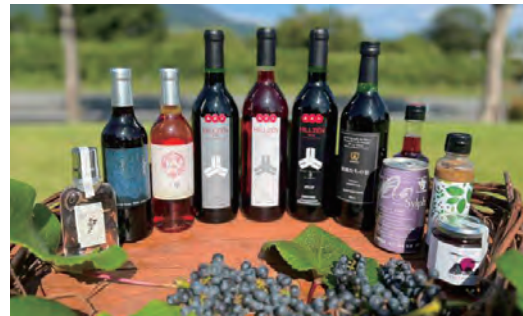
ひるぜんワインのラインナップ

さらに市内民間企業に資本参加を求めて真庭市の資本比率を10%程度に下げるなど民営化を進め、グリーンブルヒルゼンに隣接した土地に、次世代のヤマブドウ栽培を目的とした新圃場をオープンしました。農業振興から特産品開発、さらに観光に寄与するまでになった「ひるぜんワイン」の挑戦は続きます。