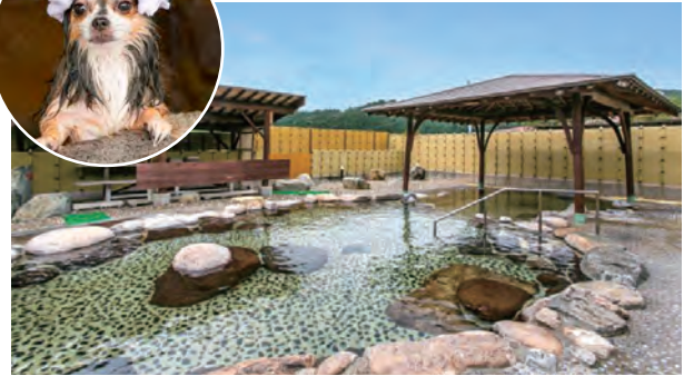
ペット用も併設する下湯原温泉の露天風呂

客層の獲得につながっています。さらに有害鳥獣対策で捕獲したニホンジカの2次処理加工を行い、ひまわり館での料理提供や鹿肉販売、またペットフード等への販路拡大を行い、地域と密着した経営を展開しています。