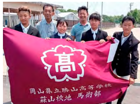
インターハイ優勝などの実績をもつ勝山高校蒜山校地馬術部

蒜山地域では高校生や専門学校生は、中国四国酪農大学の生徒と同様、地域でアルバイトなども行い、地元にとって必要不可欠な存在であり、住民に親しまれ、かつ地域の活性化に大きく貢献しています。