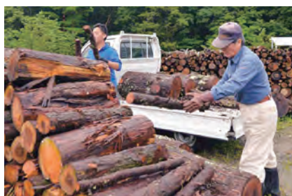
薪を収集する住民

組みを構築し、「ひと」が活躍する舞台となりました。そして「ひと」は、その舞台の上でつながり化学反応を起こします。そこには持続可能な地域づくりがあり、共生社会があります。真庭市が目指す「真庭ライフスタイル」の1つの形がここにあります。