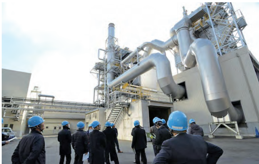
国内外から見学者が訪れるバイオマス発電所

電気の“地産地消”も広がりました。稼働から1年後、発電した電気の一部を真庭市庁舎へ供給したのを皮切りに、順次市内の公共施設へ拡大。令和6年時点