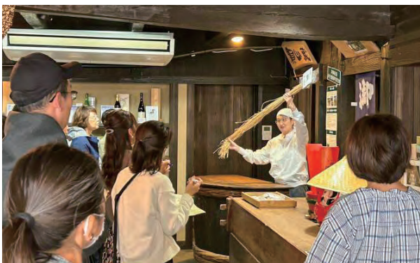
酒蔵を見学する発酵ツーリズムの参加者

真庭観光局として実施した事業は、まず市民に真庭を知ってもらおうと「市内SDGs交流ツアー」を実施。これまで市民約6,000人が参加し、市民が真庭を見直す企画となりました。真庭に住む素敵なひとに会いに行くツアーとしては、発酵の息づくまち“真庭”を巡る「まにわ発酵ツーリズム」、寺院有志がお寺の魅力を届ける「旅僧まにわ」などが開催され、人気を博しています。