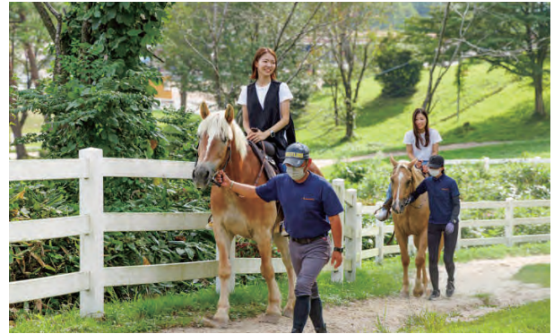
ライディングパークの乗馬体験

地元の馬術スポーツ少年団も人気で、さらに勝山高校蒜山校地馬術部も当施設で指導を受け、全国トップクラスの成績を残しています。さらに、施設と運営団体の馬事全般のレベルの高さが着目され、岡山理科大学専門学校ホーストレーニングコースの実習施設と位置付けられ、2年生は競走馬等の厩務員