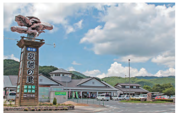
いろいろな事業を展開する道の駅「醍醐の里」

平成14年（2002年）、国土交通省の道の駅を中核施設として、旧落合町が農産物直売所を整備しました。「有限会社醍醐の里」が開設時から運営を行っており、直売所としては真庭市南部最大規模に成長しました。さらに施設内の農産物加工場は、出荷者自らが衛生的に農産物等の加工が行え、農家の収入増の一助になっています。単なる農産物直売所にとどまらず、自主事業でレストランや地域の高齢者のための給食サービスを展開し、市役所と連携したリユースプラザは地域の不用品活用の場ともなっており、