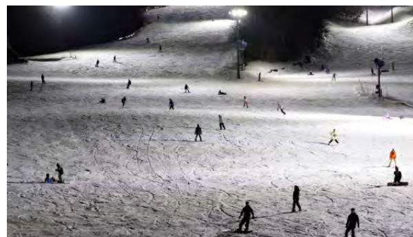
夜も楽しめるひるぜんベアバレースキー場

移動を柔軟に行い、地域住民の通年雇用に寄与しています。従業員総数（アルバイトも含む）は75人（令和7年9月時点）。地域主導の観光事業を展開する姿勢は指定管理施設としての評価も高く、第3セクターの成功例と評価されています。