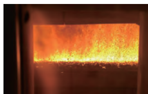
チップが投入されたボイラーの燃焼炉