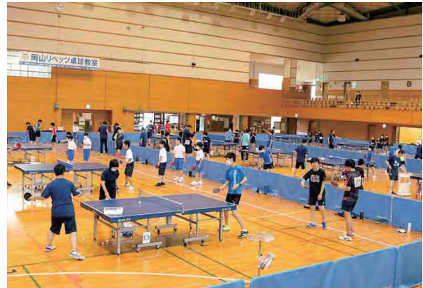
主催した岡山リベッツ卓球教室

令和6年、公益財団法人に移行。主催事業として年間60事業を超える市民の年齢・性別に合わせた健康づくりなどの教室を実施しています。さらに総合型スポーツクラブなどと共催してのスポーツ教室を年間50回程度行うなど、真庭市のスポーツ振興の中核となる財団に成長しました。