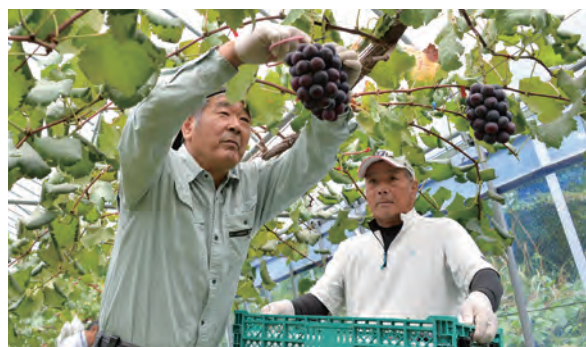
先進事例として取り組むブドウ栽培

さらに、特筆すべきは実際の作業者が農業公社を支援する一般市民だということです。まちづくり団体と地域住民一体となった取組は、蒜山地域全体でのブドウ栽培拡大や、移住者等新規就農者の呼び込みに大きく貢献する好事例となっています。