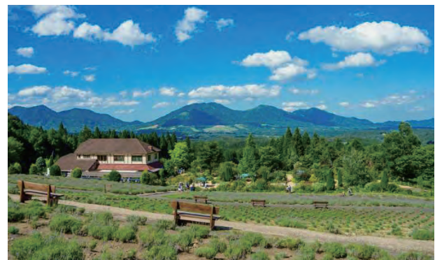
蒜山三座をのぞむ蒜山ハーブガーデンハービル

移動を柔軟に行い、地域住民の通年雇用に寄与しています。従業員総数（アルバイトも含む）は75人（令和7年9月時点）。地域主導の観光事業を展開する姿勢は指定管理施設としての評価も高く、第3セクターの成功例と評価されています。