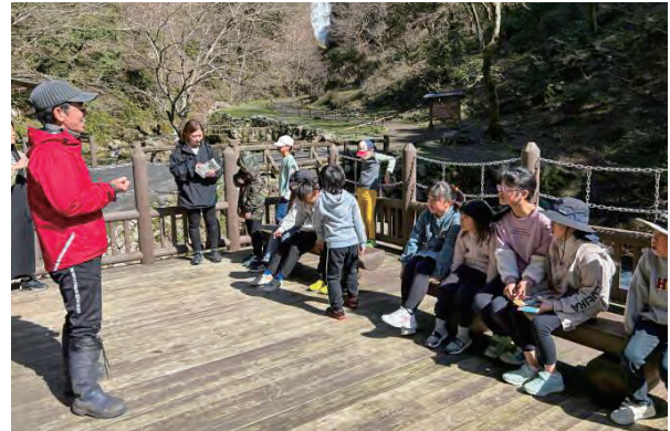
「市内SDGs交流ツアー」に参加する市民

平成18年に始まった「バイオマスツアー」は産業観光拡大事業として展開。コースの充実やプロモーションの強化などを図り、参加者は令和6年度末で累計4万人を超えました。また、インバウンド強化事業として台湾と韓国にツアーデスクを置き外国人観光客の誘致も進めています。