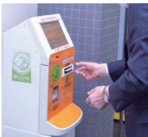
チャージ機で入金

市民の間では、健幸ポイントの獲得数が話題になるほど関心を集め、運動習慣の動機付けや定着に大きな効果を上げています。