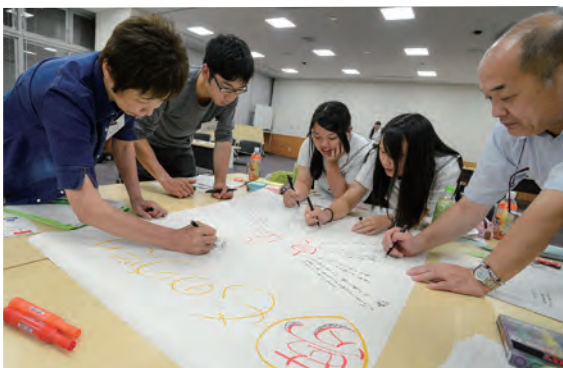
会議ではさまざまな世代が意見を交わしました

そして1年間の議論を経て、委員の思いは、『25年後の未来（2040年）の真庭市は、こんな「まち」になっていて、こんな「ひと」が住んでいてほしい』という未来像へと結実していきます。