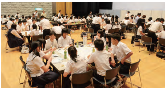
学生版の会議には市内の高校生 114人が参加しました