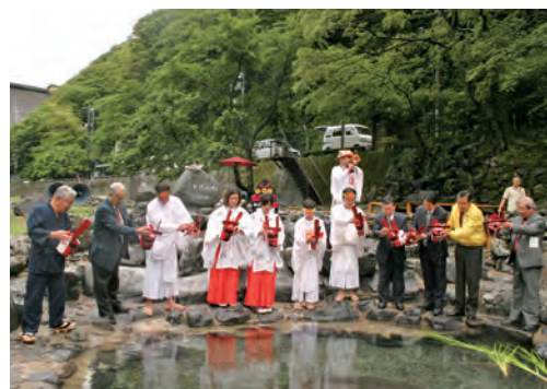
湯原温泉11カ所の温泉を融合する「露天風呂の日」のイベント