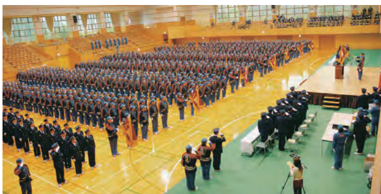
真庭市消防初出式

消防団活動は火災や災害時の対応だけに限りません。「安全・安心なまちづくり」を使命に、独居高齢者世帯の訪問や周辺の雪かき、住民への防火指導をはじめ、地域コミュニティを支える広範な活動を引き続き担っています。