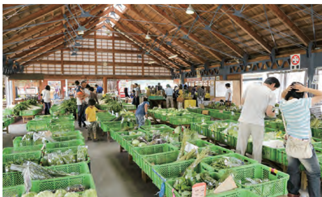
道の駅「風の家」(蒜山上徳山)

続いて平成23年5月、官民協働の「真庭あぐりネットワーク推進協議会」を設立。市内7直売所のPOS（販売時点情報管理）システムの統一や、どこの直売所にも出荷できるトラック周回システムの構築に着手しました。