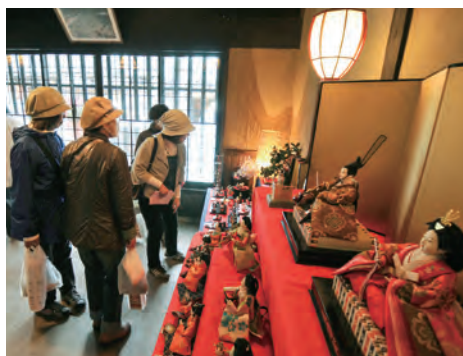
観光客でにぎわう「勝山のお雛まつり」

同時に真庭市は、新たな施策として産業と観光を融合した「バイオマスツアー真庭」を平成18年(2006年)にスタートさせました。当時、バイオマス利活用の取組が全国的に注目を集め、市役所や関連施設に視察者が相