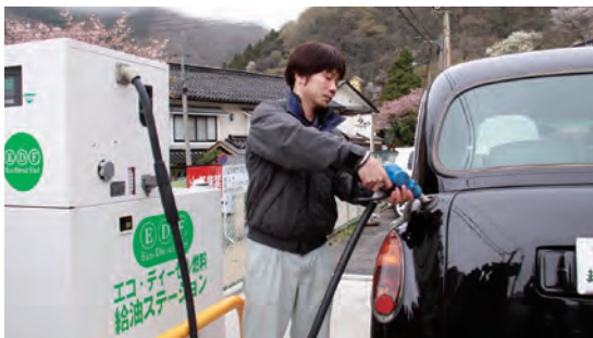
エコディーゼル燃料給油ステーション

湯原町旅館協同組合は地元企業と連携し、平成17年(2005年)から地域の家庭や旅館・ホテルから回収した使用済みの天ぷら油を軽油の代替燃料BDF(バイオディーゼル燃料)に精製する事業を開始。平成21年4月から、温泉街に設置した給油ステーションで旅館の送迎車などに供給し、「エコディーゼル燃料(EDF)」と呼んで、人と環境に優しい温泉をアピールしています。