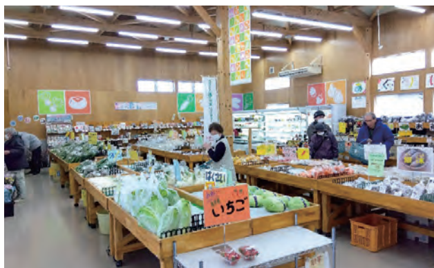
JA直売所「きらめきの里」(中島)

令和5年度の市内外9店を合わせた売上総額は約10億円に達し、令和7年12月時点で、登録者数は2,775人になっています。