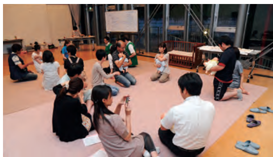
妊婦さん夫婦のパパママスクール