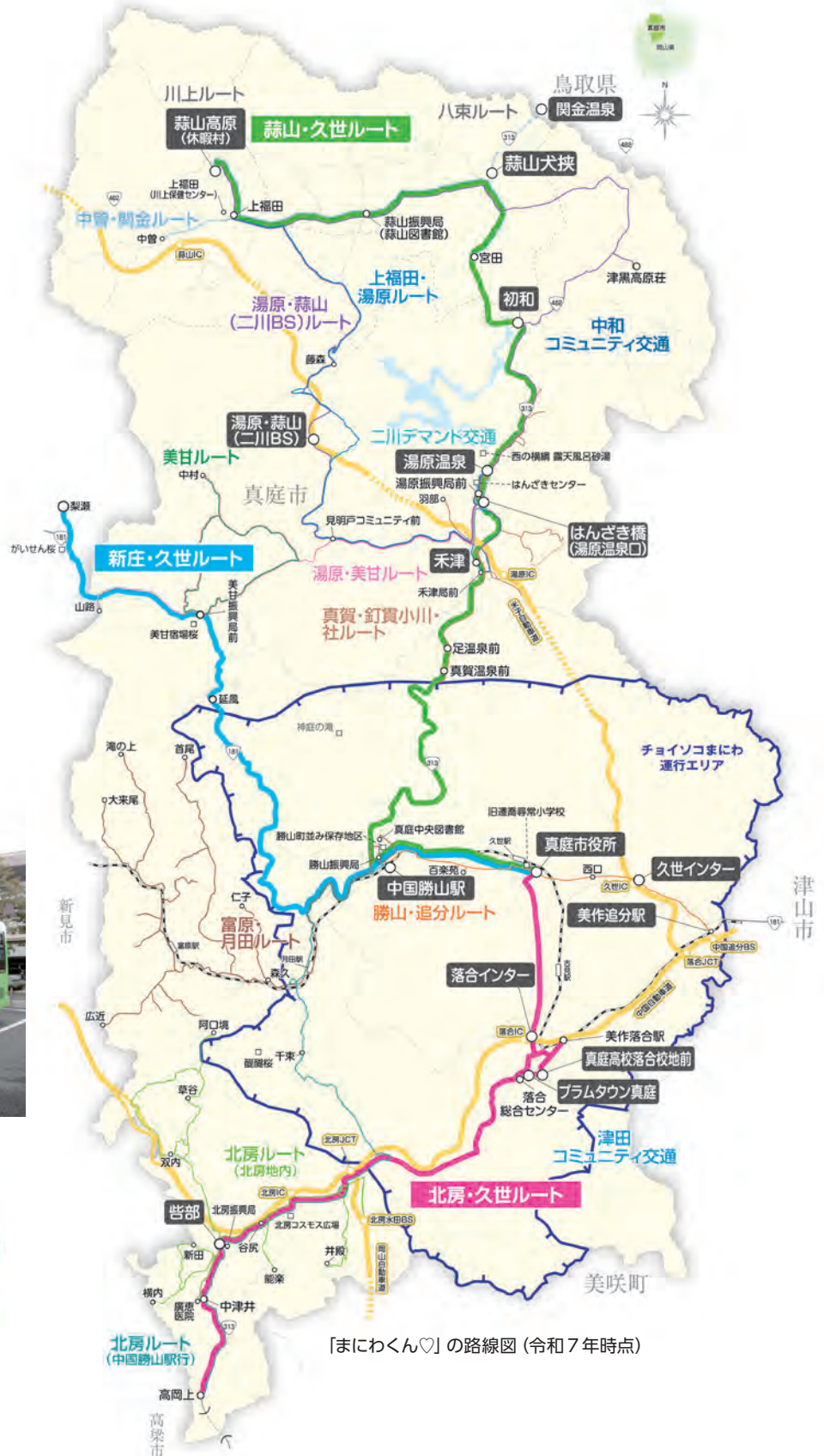
「まにわくん♡」の路線図（令和7年時点）

同年10月末、民間バス会社が市内の全11路線を廃止しました。このため代替の7ルートを新設して、通院、通学などの交通手段を守りました。その後も必要性や効率を考慮して新設、変更、再編が行われ、令和7年時点で幹線3ルート、枝線13ルートで運行されています。