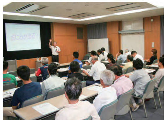
ラストワンマイル事業の説明会