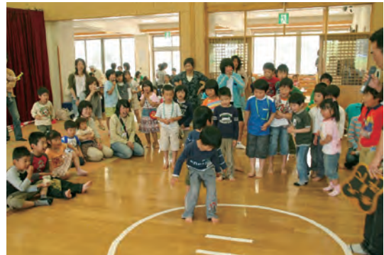
親子連れや地域の人でにぎわう「つどいの広場」

また、乳幼児を持つ親子が相談・交流する「つどいの広場」や、小学生を対象とした「放課後児童クラブ」などの活動を支援したほか、市の保健師、栄養士が各地域に出向き、地域の愛育委員、栄養委員と協力して育児の応援に努めました。