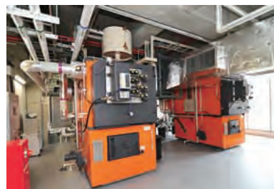
市役所へ導入されたバイオマスボイラー