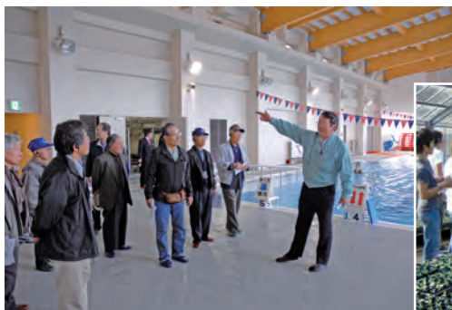
バイオマスボイラーを使った温水プール「水夢」を見学するバイオマスツアー

「バイオマスツアー真庭」は、新エネルギーの普及・啓発に寄与したと評価され、平成22年、「新エネ大賞」の最高賞「経済産業大臣賞」を受賞しています。