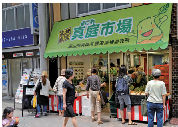
高槻市に開店した真庭市場

また、市外での販売は、同年9月から大阪・高槻市に「真庭市場」を開店。新鮮さと安全が評価され、平成27年度には年間売り上げ額が約1億5,000万円を上回りました。