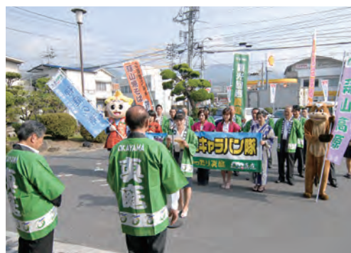
東京方面へ出発する観光キャラバン隊