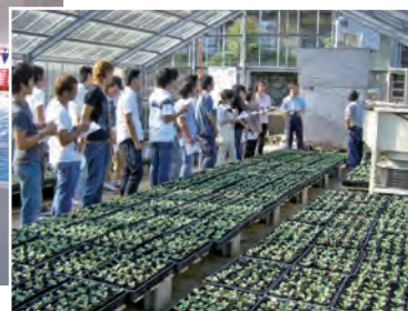
バイオマスツアーの農業コース。ボイラーを活用したハウスを見学