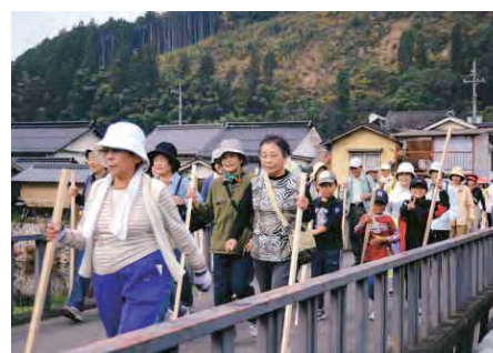
地域のコミュニティ協議会主催のウォークラリーを楽しむ住民

力ある地域づくり事業補助金」を創設し、地域自主組織が取り組む地域コミュニティの再生、活性化を支援しました。