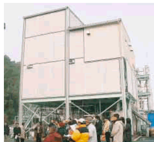
真庭産業団地に整備された木材チップからエタノール(工業用アルコール)を製造する実証プラント

一方で、エネルギー利用だけでなく、木質バイオマスから化学品や新素材、燃料などを生産するバイオマスリファイナリー事業にも着手。産学官連携で木質資源を余すところなく活用するための検討が始まりました。