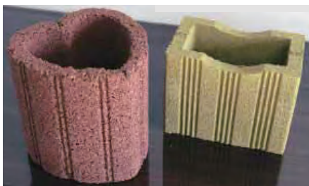
木材とコンクリートを融合させたガーデニング用製品

こうした中で、新生・真庭市が地域活性化の起爆剤として掲げたのが「バイオマスタウン真庭構想」です。民間主導の木質バイオマス関連事業に連携して、新しい産業の創出や環境にやさしい循環型社会