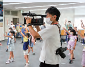
イベントを撮影するスタッフ