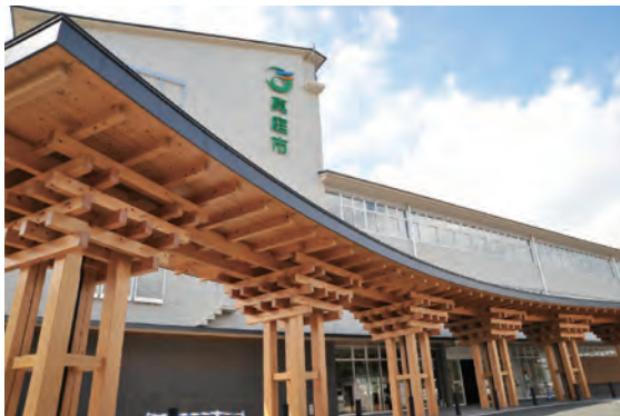
久世に建設された市役所本庁舎

市役所本庁舎については、急激な施設再編は市民の不安を招く恐れがあることから、当初は本庁機能を勝山・久世・落合に分散していましたが、平成23年に合併協議のとおり久世に本庁舎を一本化しました。これにより特に管理部門が統合され、行政の効率化が図られることとなりました。