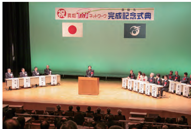
真庭ひかりネットワーク完成記念式

その中核になったのが、市独自のケーブルテレビ局（真庭いきいきテレビ）の開設でした。身近な情報を自主放送やデータ放送で市内全域に流し、同一の情報を共有することで市民の一体感醸成に大きく