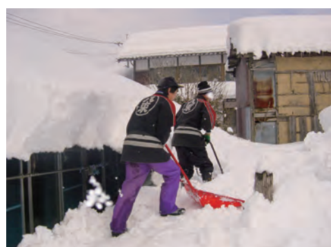
高齢者世帯の雪かきを行う蒜山方面隊