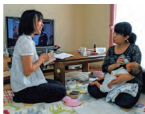
赤ちゃん全戸訪問