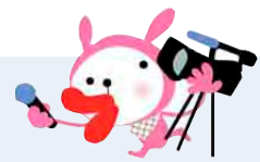
MITマスコットキャラクター「みとすけ」

令和7年3月末時点で加入率約74%、加入1万2,775件。自主放送はニュース番組：週150分以上、企画番組：週3番組、生中継：年間12本程度を届けています。