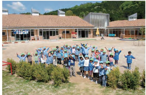
県内初の認定こども園となった落合こども園の園児たち

平成21年3月には子育てに関する情報を集めたウェブサイト「真庭こどもICT（愛して）ネットワーク」を開設。妊娠、出産、就学などに関する行政サービスや各学校情報など、さまざまな情報の発信を始めました。