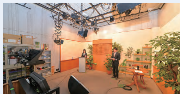
スタジオでの番組制作風景