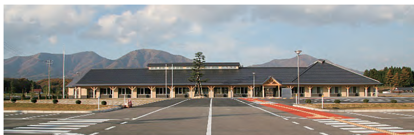
駐車場から事務所までバリアフリー設計の蒜山振興局

他の支局についても、設置目的を地域振興に特化し、さらに地域住民の利便性向上の観点から公共施設の集約化を進めました。