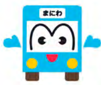
「まにわくん♡」イメージキャラクター

同年10月末、民間バス会社が市内の全11路線を廃止しました。このため代替の7ルートを新設して、通院、通学などの交通手段を守りました。その後も必要性や効率を考慮して新設、変更、再編が行われ、令和7年時点で幹線3ルート、枝線13ルートで運行されています。