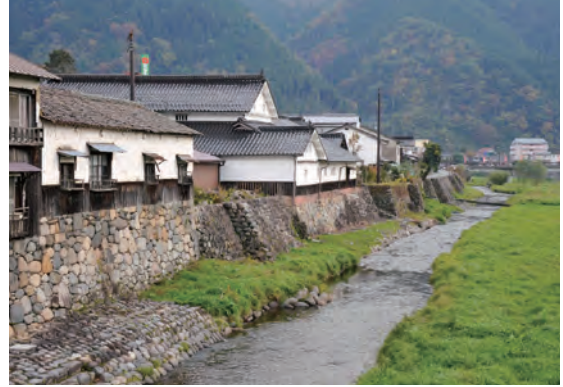
高瀬舟発着場跡（勝山）

平成12年には、国より「行政改革」の視点で「日本を1,000程度の自治体に再編成する」方針が示され、全国的に市町村合併が積極的に推進（平成の大合併）されるようになりました。