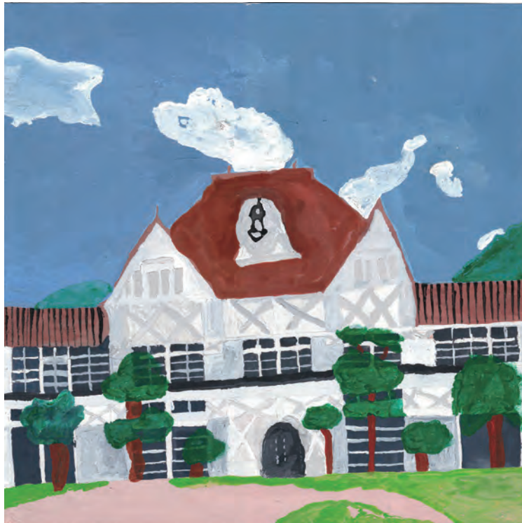
久世・旧遷喬尋常小学校