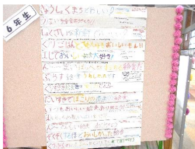
給食委員会が作成した プレゼンテーション資料と お礼のメッセージ