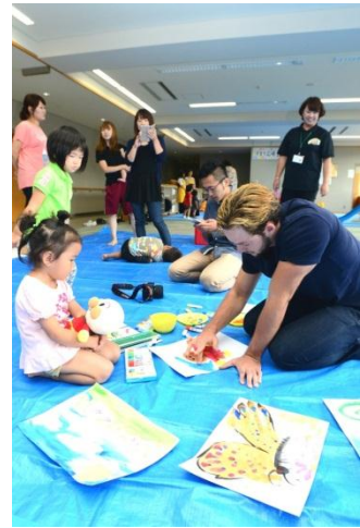
ほたるっことのお絵かき教室(9月15日)