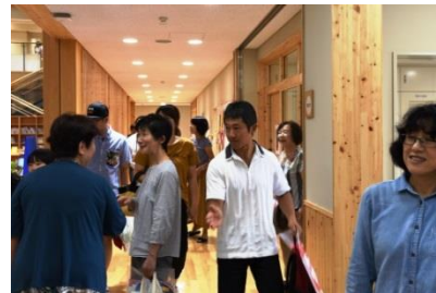
◀校舎・園舎の中を思い思いに見学する来場者

また、見学会に合わせて北房観光協会などが特産品販売や地域PRをするテントを設置。テントには、農泊推進の取り組みで北房との連携が始まった岡山商科大学の学生も参加し、出展者と一緒に北房のPRに汗を流しました。