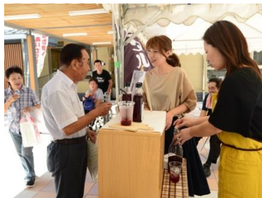
▲PRテントに出展したコスモスワーク(左)とママン(右)