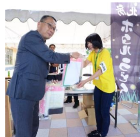
▲来場者に北房のPRをする岡山商科大学の学生ら