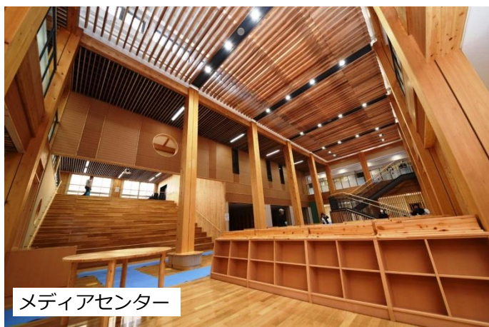
メディアセンター

この敷地内では、放課後児童クラブも活動することとなっており、これから、小学校とこども園とともに一体的な子育て・教育環境を築いていきます。