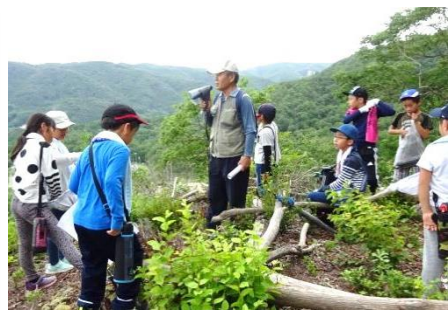
生き物ふれあい自然体験教室