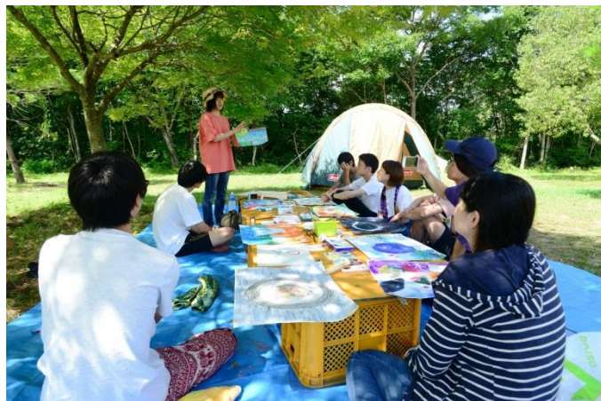
アートキャンプを楽しむ若者たち

これから本格キャンプシーズンが到来します。公園内には、キャンプエリアだけでなく芝生が一面に広がる「花見広場」もありますので、お弁当を持って行って食べるだけでも気持ちの良い時間が過ごせます。キャンプ利用者に負けず、北房地域の皆さんも、ぜひもみじ公園をご利用ください。