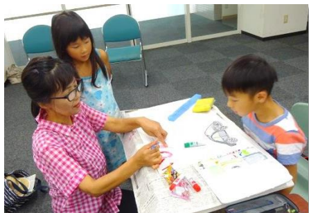
にこっと絵画教室