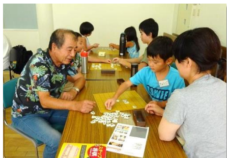
のびのび将棋教室