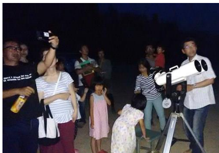
夏空星空観察教室