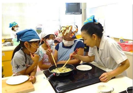
パットさっとお菓子教室