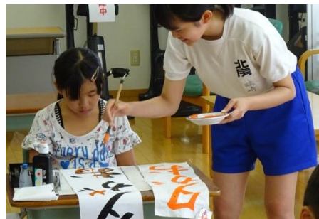
きりっと夏習字教室