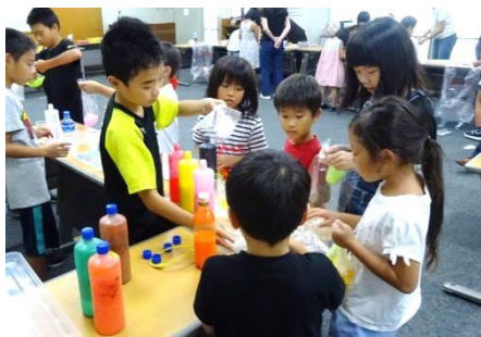
わくわくドキドキ科学教室