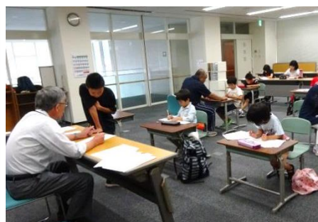
のんびり学習教室