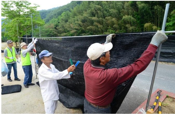
遮光幕を設置する保存会の皆さん

本格シーズンを控えた5月26日、北房ホタル保存会では、車のヘッドライトなど人工の光からホタルを守る「遮光幕」を備中川沿いに設置