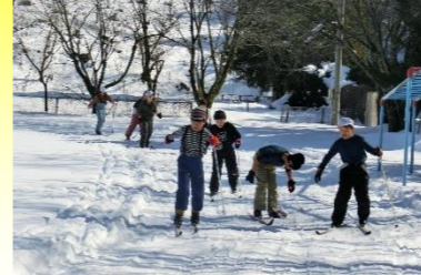
「地域が応援したい学校」