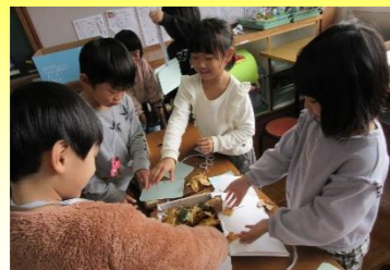
「児童が行きたい学校」