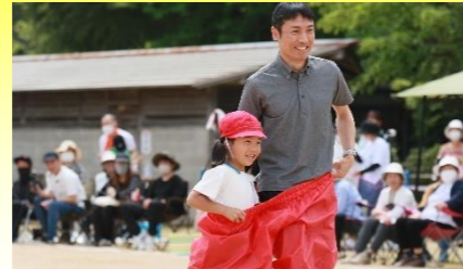
「家族が行かせたい学校」