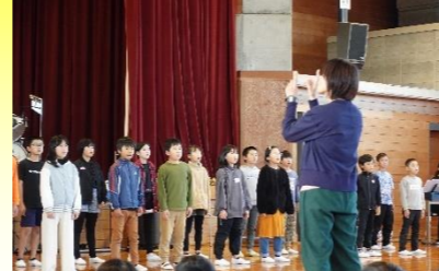
「職員が働きたい学校」