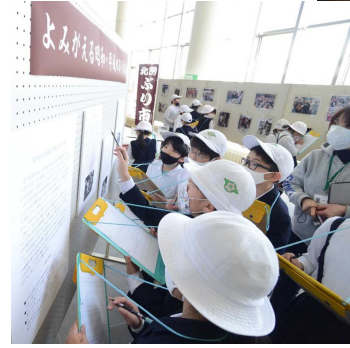
2月10日にぶり市展を見学に来た北房小学校の児童ら