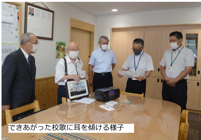
できあがった校歌に耳を傾ける様子

また、CDはこのほかに作詞者や作曲者など、小学校校歌の制作に関わった人たちにも贈られる予定です。