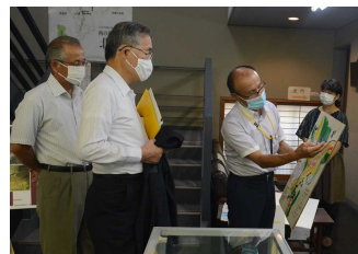
太田市長はこれに合わせてふるさとセンターを見学