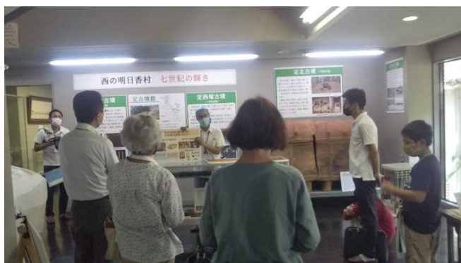
展示解説ツアーの様子

す。そんな、米作りに欠かせなかった石包丁を実際に作ってみるワークショップです。どうぞ、ご参加ください。