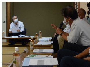
市長と意見交換をする会のメンバー