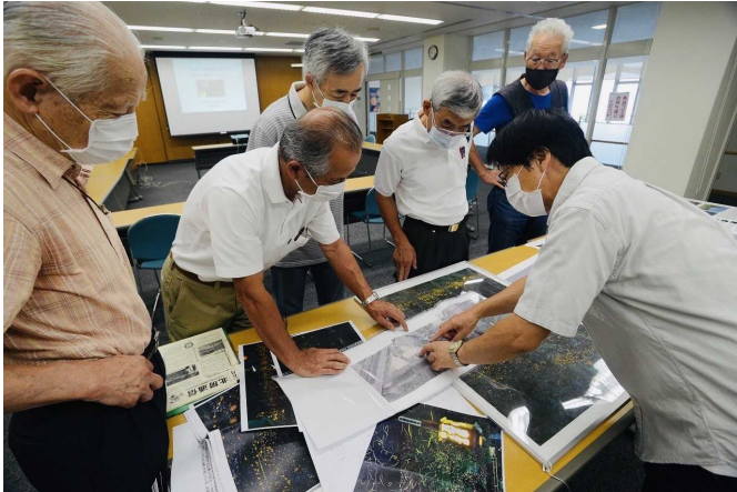
展示内容について意見を交わす保存会の会員(7月25日)

北房ホテル保存会が節目の年の活動に精を出しています。保存会の前身である「ホテルを守り育てる会」が発足したのが1970年(昭和45年)。北房でホテルの保護活動が始まってから今年でちょうど50年になることから、保存会ではさらなる保護活動や積極的なPRをしようと準備を進めています。