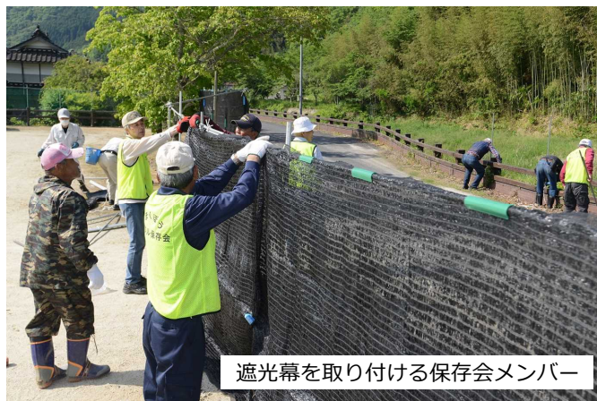
遮光幕を取り付ける保存会メンバー

動をより充実させるため、こうした展示の充実やヘイケボタルの生態研究などに取り組みもうとしています。活動を広くPRし会員の募集にもつなげていこうと、今後の意欲的な活動に向けて意見を出し合いました。