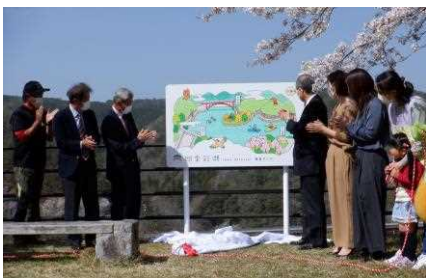
◀4月2日に行われた愛称お披露目のセレモニー

湖を見下ろせる紅葉公園に展望マップを設置し、愛称の発表と同時に関係者で看板の除幕をしました。四季彩湖一帯は、その名のとおり四季折々に鮮やかな風景に彩られ、自然散策やアウトドアに最適の場所。今後より一層の活用を進めていきます。