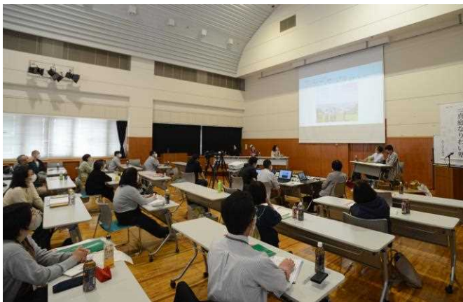
▲岡山市内で行われたプレイベントの様子

4月24日、なりわい塾の概要説明や渋澤寿一塾長の講話などを行うプレイベントが岡山市内で行われました。新型コロナウイルスの感染拡大に対応し、オンラインでの配信も行い会場とオンライン試聴合わせて約110人が聴講しました。今後、受講希望者を対象とした現地説明会を5月に実施し、塾生の募集を行う予定です。