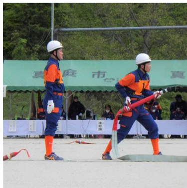
第4分団のポンプ車操法

4月29日(土)に真庭やまびこスタジアム多目的グラウンドで第9回真庭圏域消防操法訓練大会が開催されました。