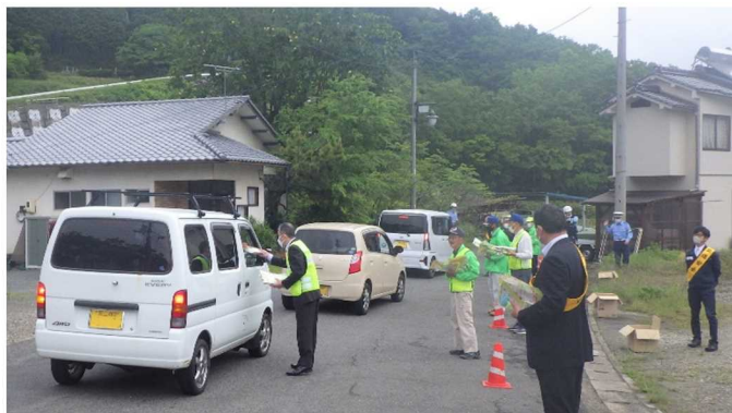
オアシス村の様子