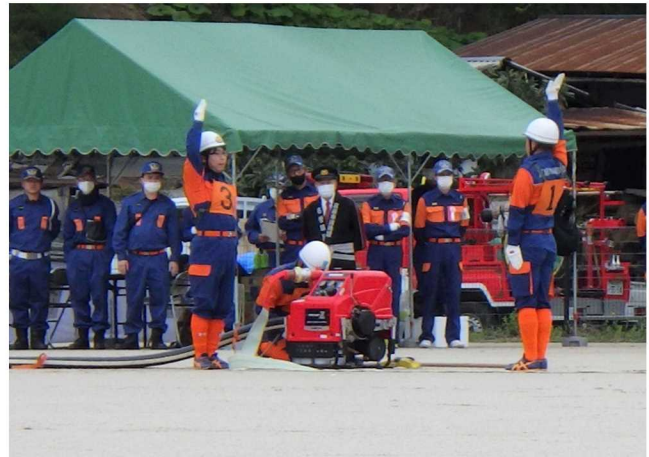
第3分団の小型ポンプ操法

昨年9月の結団式以降、分団一丸となって練習を重ね、大会に挑み、小型ポンプ操法の部では、