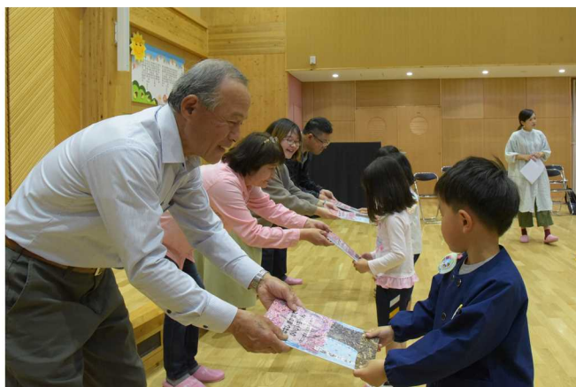
実行委員や塾生から絵本を受け取る園児

5月11日(木)、真庭なりわい塾北房実行委員会となりわい塾第5期の塾生から、北房こども園に絵本「おはなしきかせてひいじいちゃん～阿口の歴史とたからもの」が渡されました。また、大型のパネルを使用した読み聞かせも行なわれ、園児たちは真剣な表情で聞き入っていました。