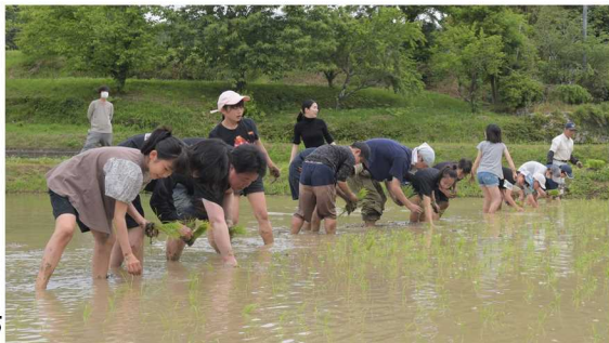
手植えに挑戦する子どもたち

5月27日(土)、北房地域に分室を構える同志社大学文化遺産情報科学調査研究センターが、山田地内の田んぼで古代米の田植え体験を開催しました。