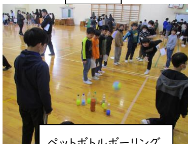
ペットボトルボーリング