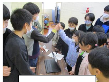
ストップウォッチゲーム