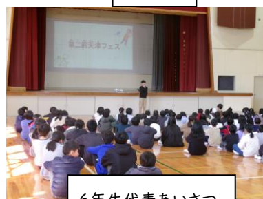
6年生代表あいさつ